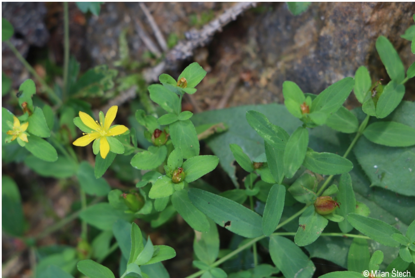
Hypericum humifusum – Milan Štech – Lohberg.