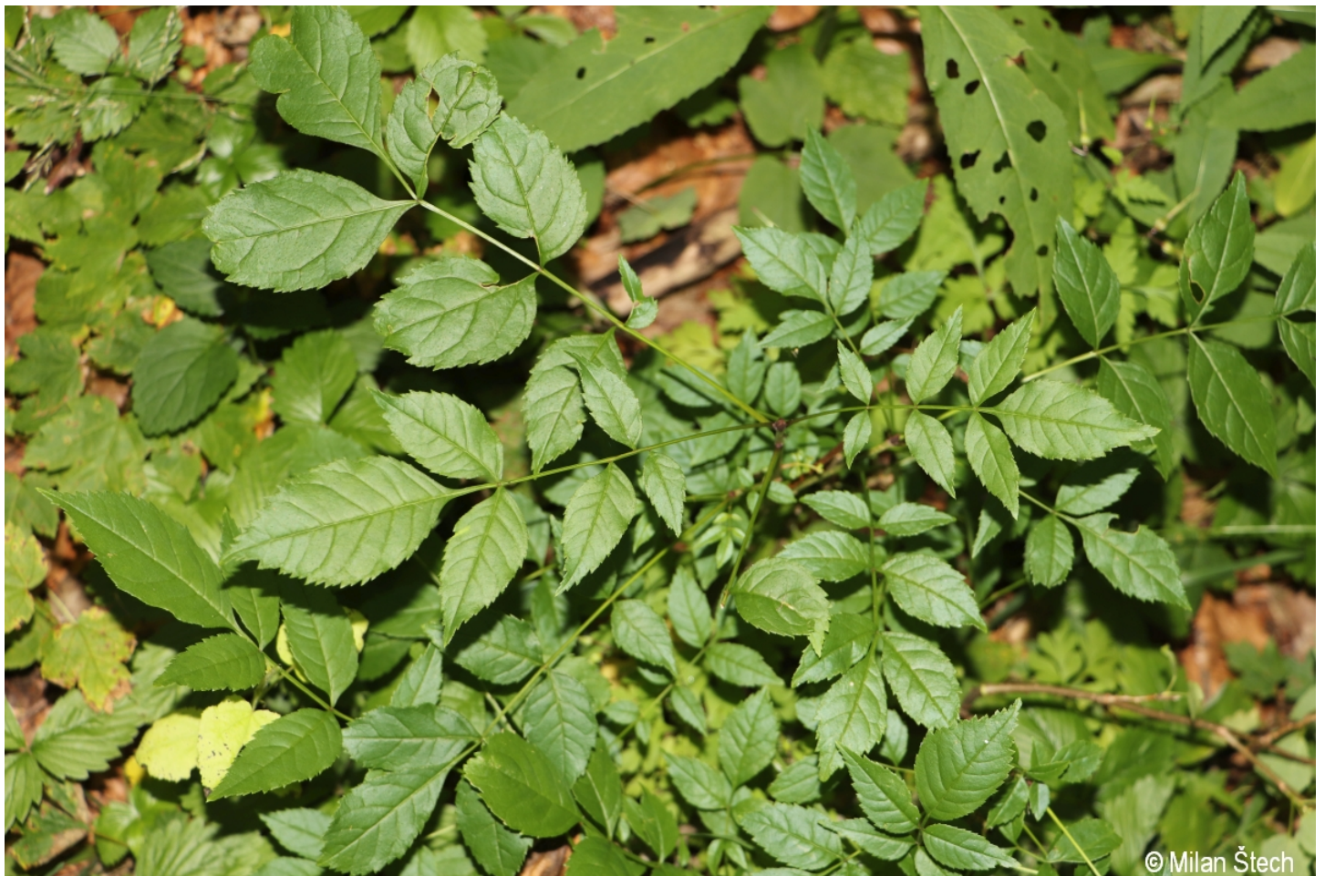
Fraxinus excelsior – Milan Štech – Horská Kvilda, Stará Huť u Zhůří.