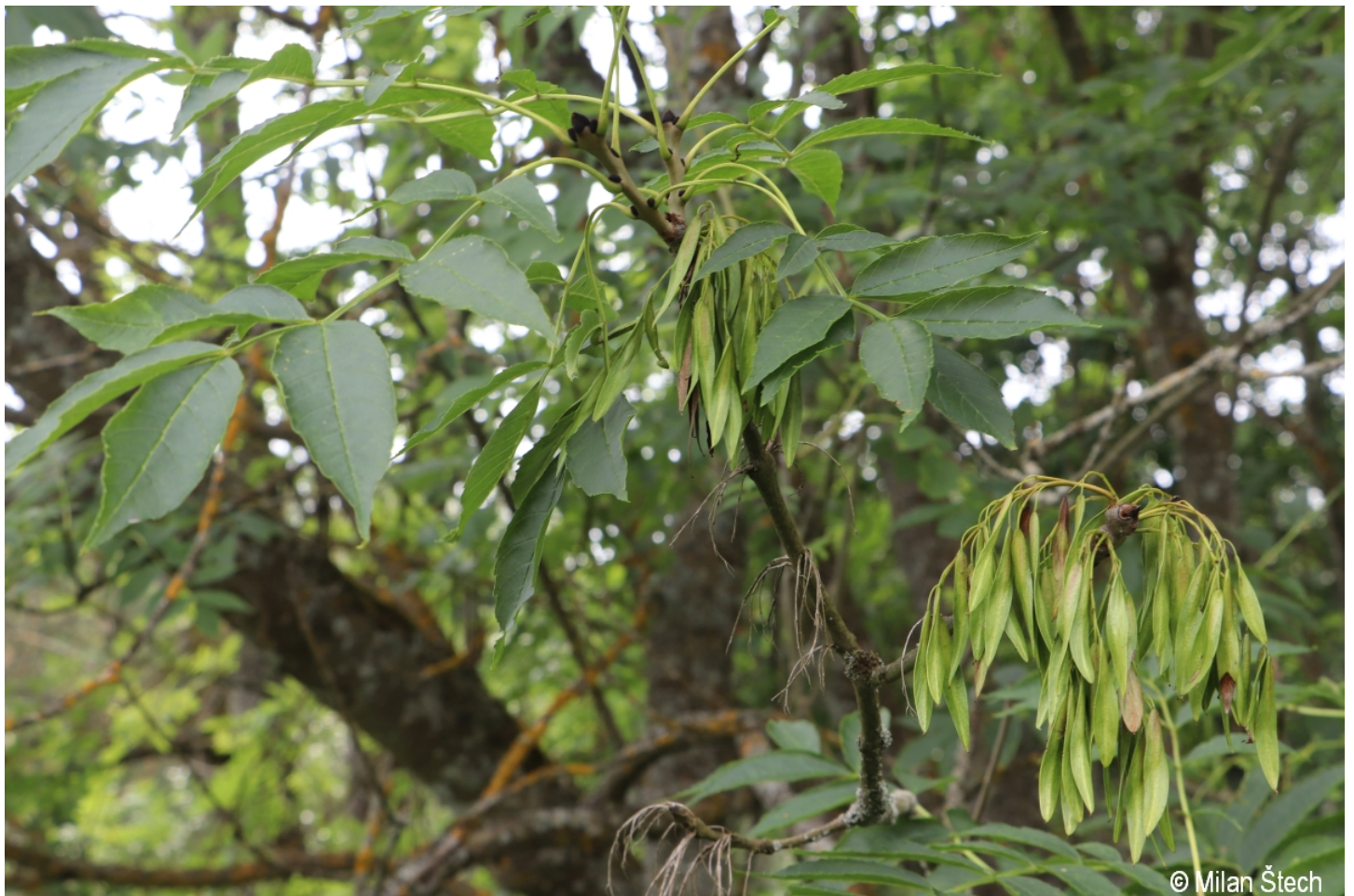
Fraxinus excelsior – Milan Štech – Želnavá.