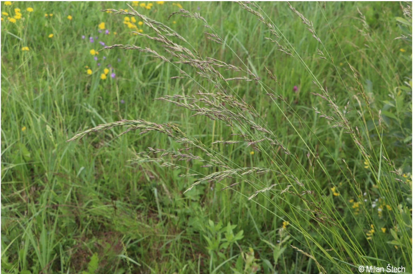
Festuca arundinacea – Milan Štech – Olšinka.