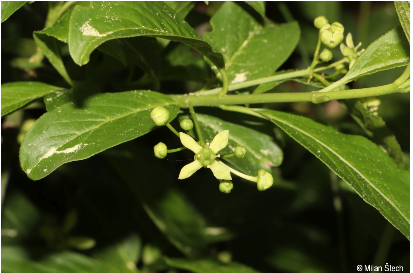
Euonymus europaeus – Milan Štech – Gumpoldsried.