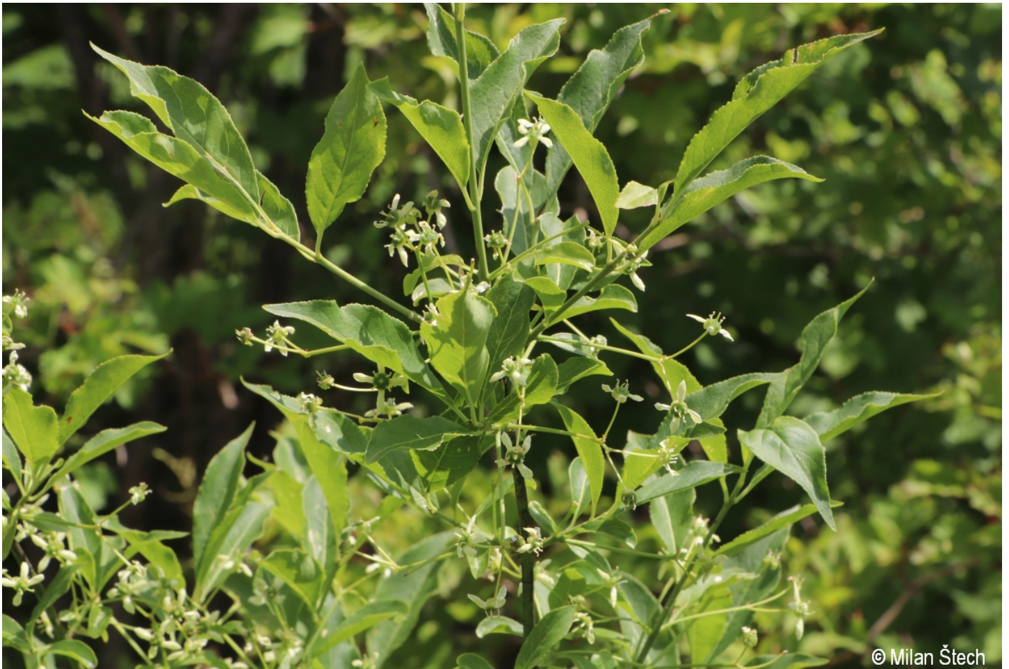
Euonymus europaeus – Milan Štech – Waldhauser.