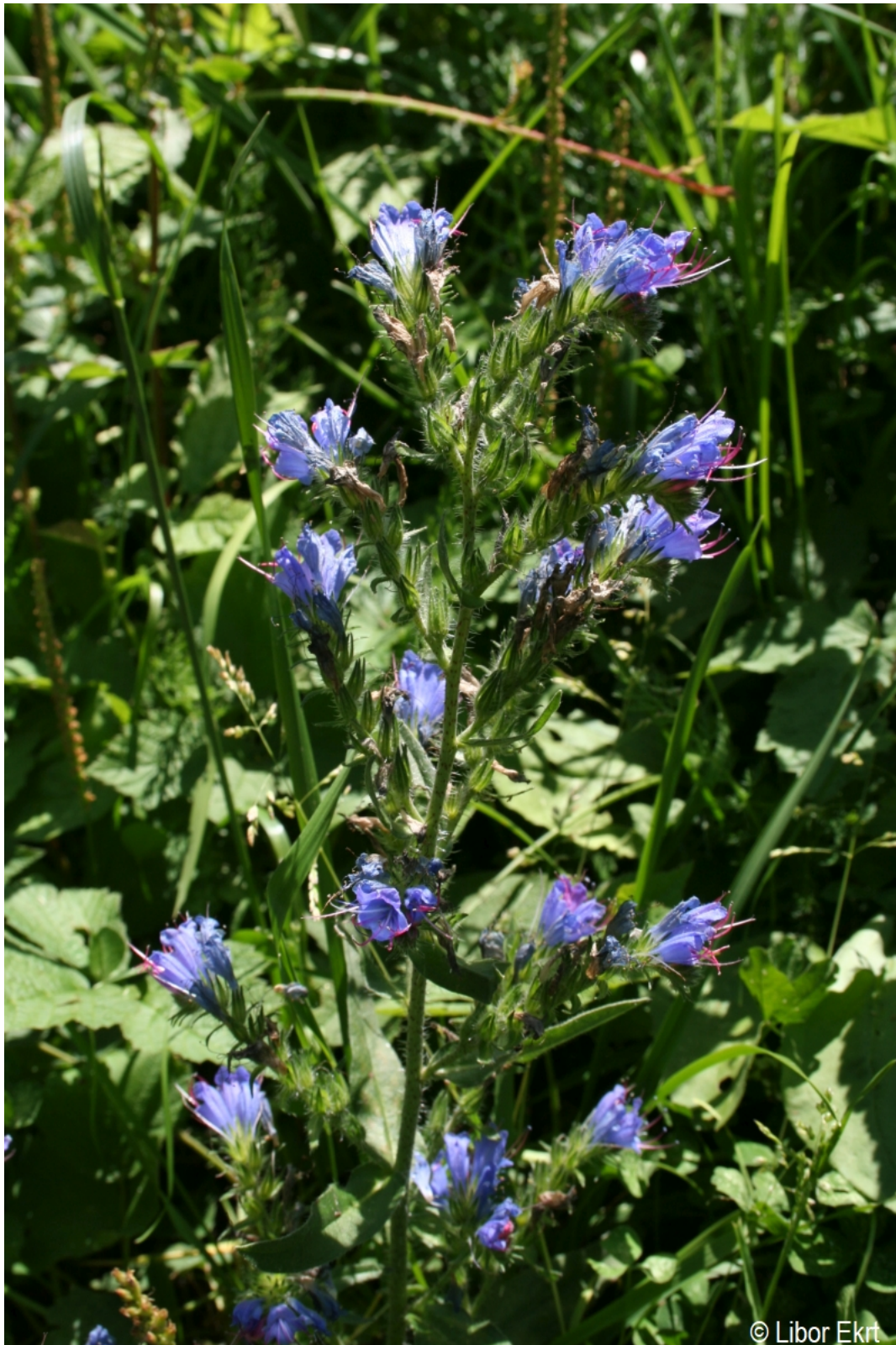
Echium vulgare – Libor Ekrt – Paště.