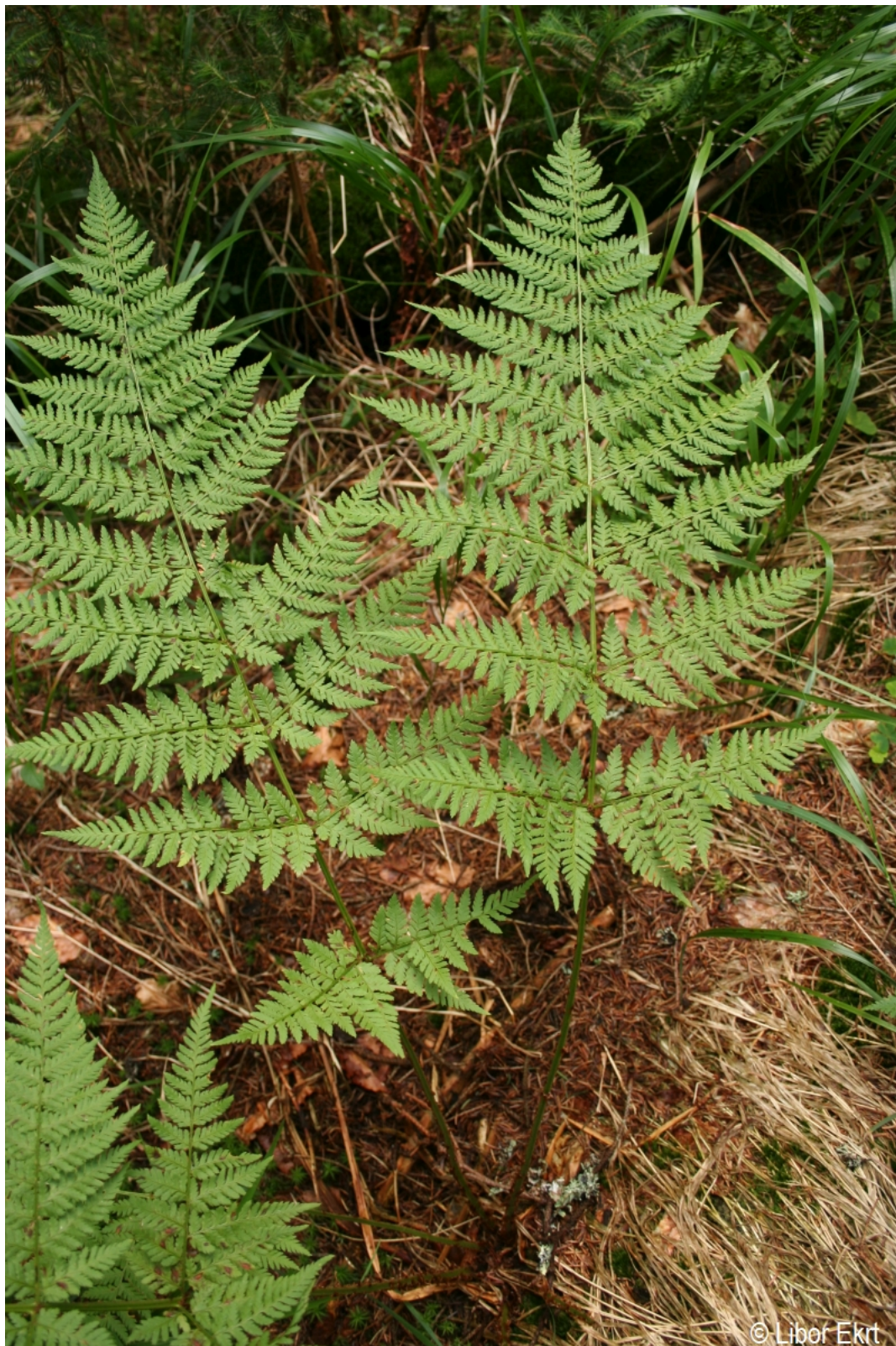
Dryopteris expansa – Libor Ekrt – Čertovo jezero.