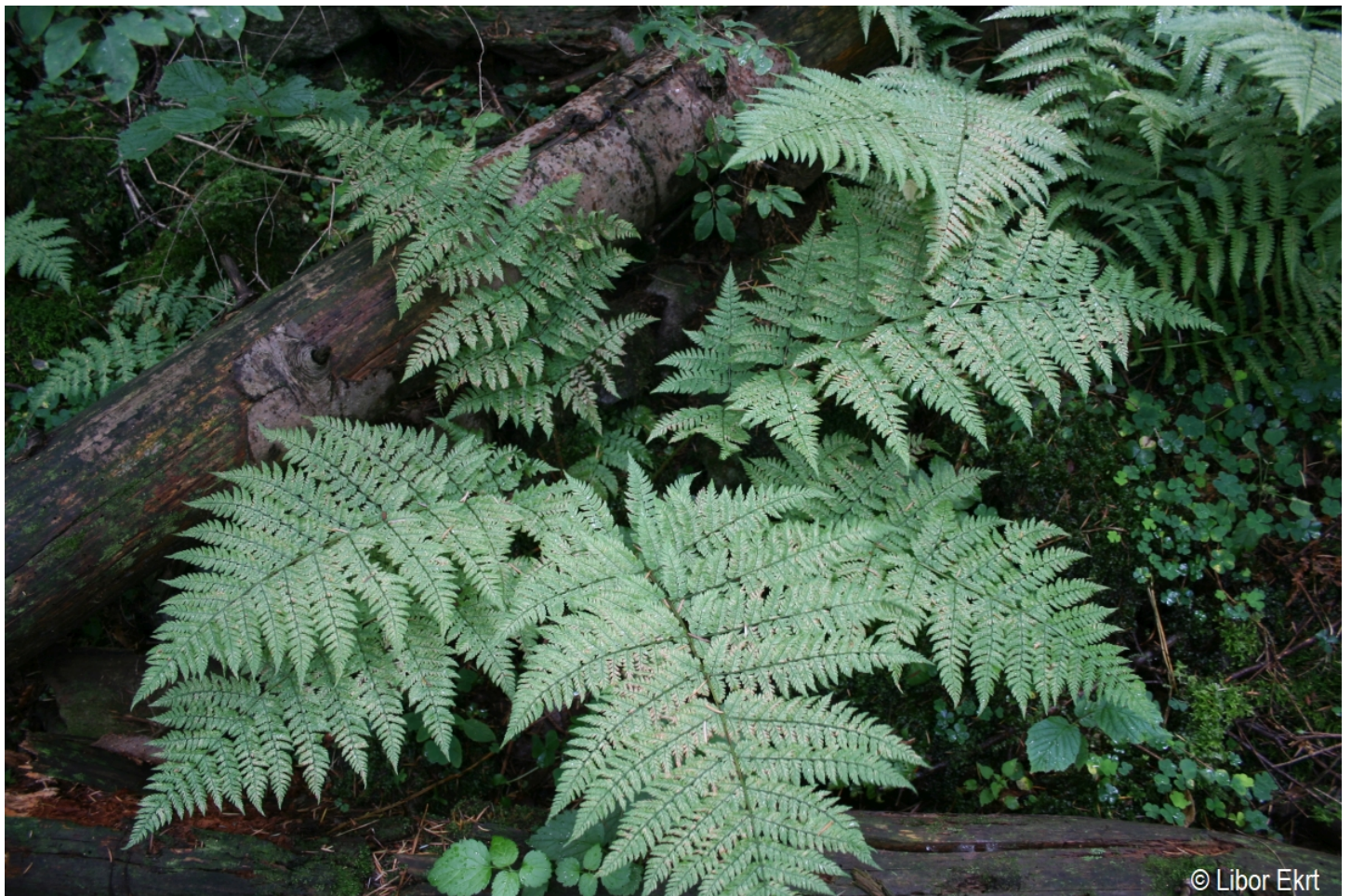
Dryopteris expansa – Libor Ekrť – Malý Plešný.