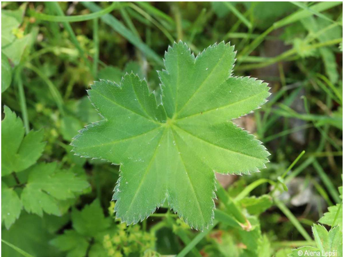
Alchemilla micans – Alena Lepší – Kašperské Hory.