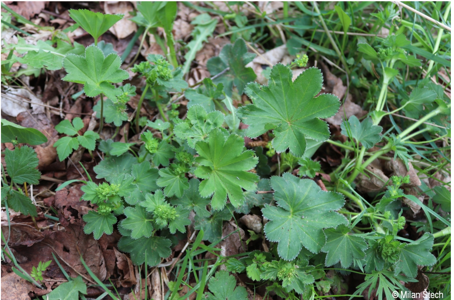
Alchemilla micans – Milan Štech – Hartmanice.