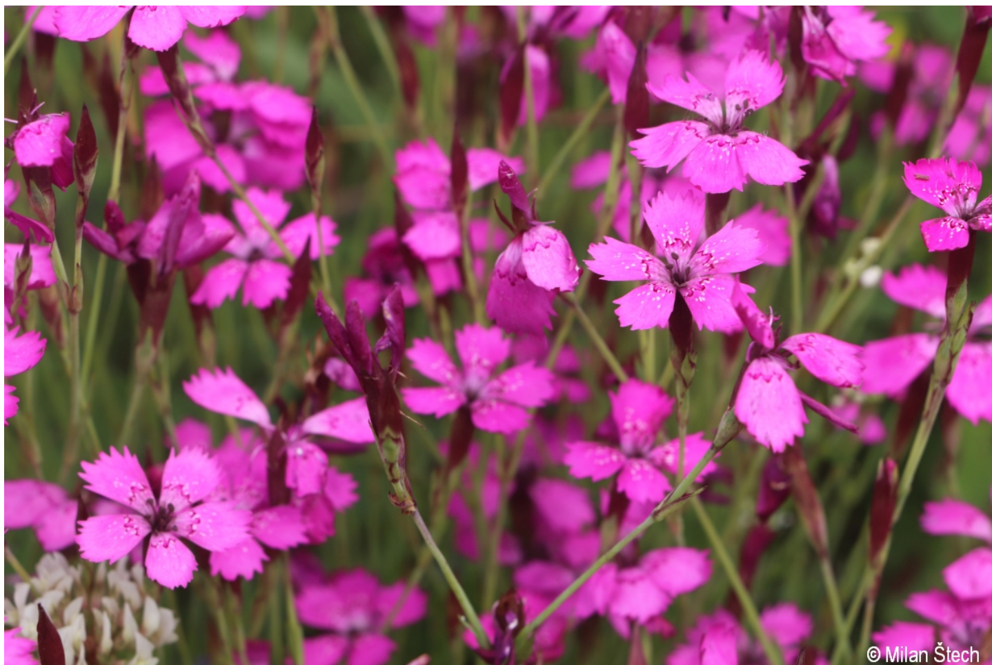
Dianthus deltooides – Milan Štech – Knížecí Pláně.