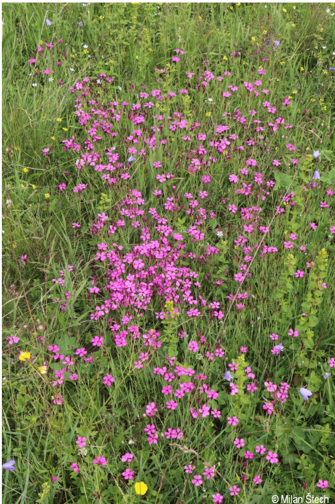
Dianthus deltoides – Milan Štech – Knížecí Pláně.