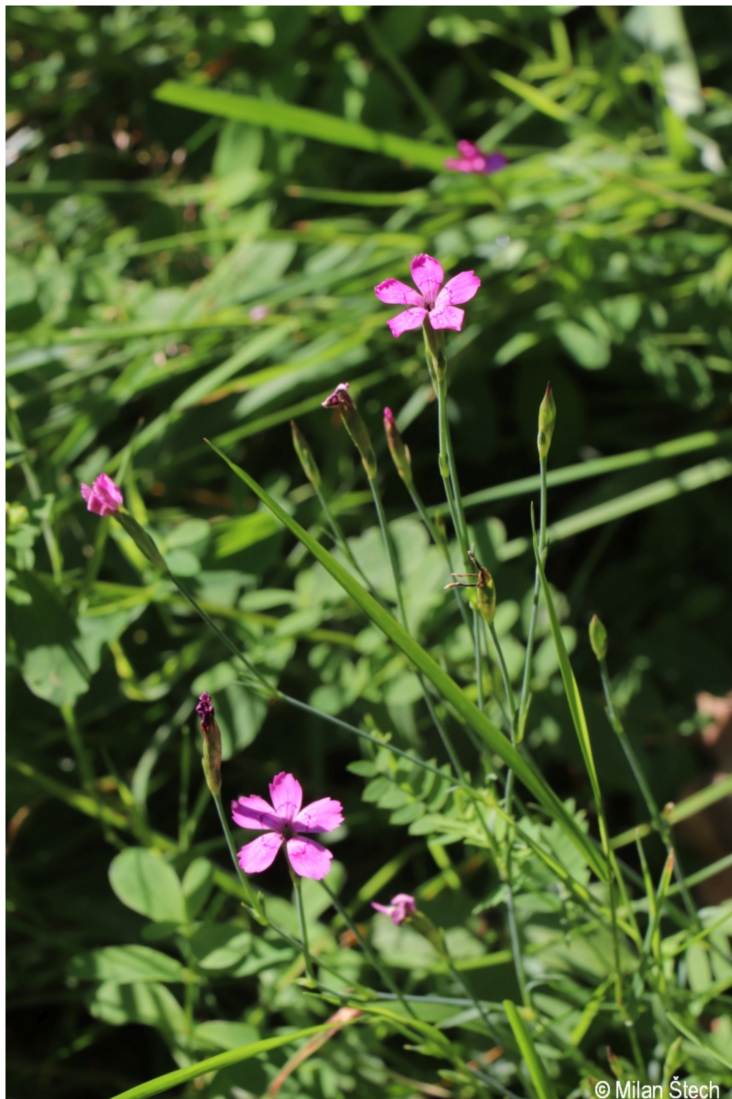
Dianthus deltoides – Milan Štech – Horská Kvilda, Stará Huť u Zhůří.