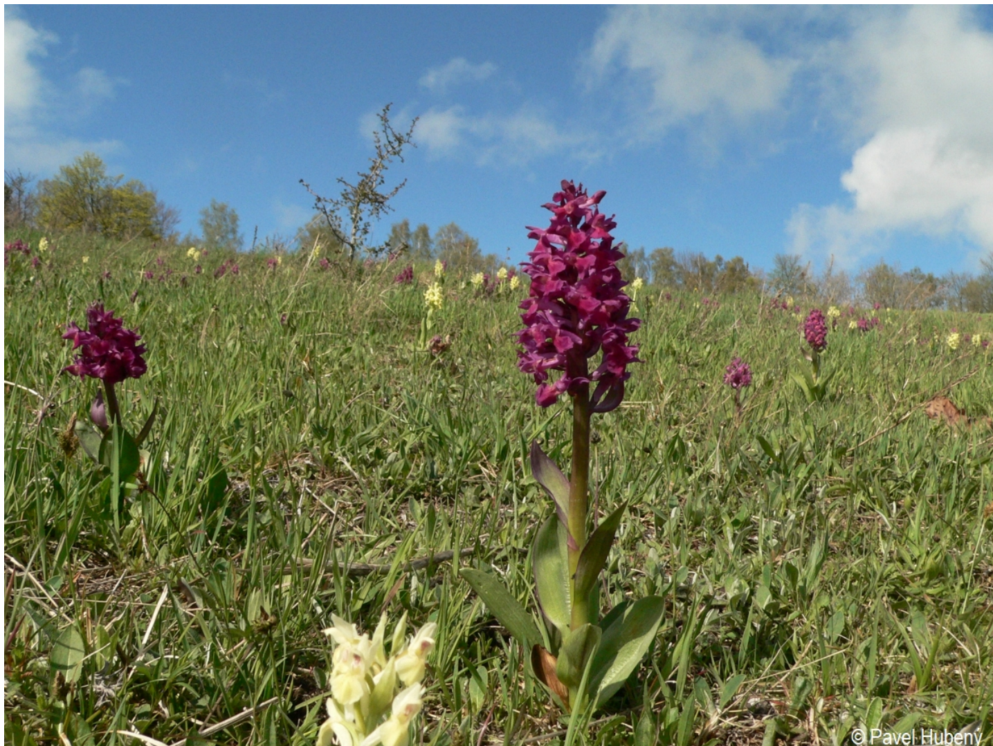
Dactylorhiza sambucina – Pavel Hubený – Řetenice.