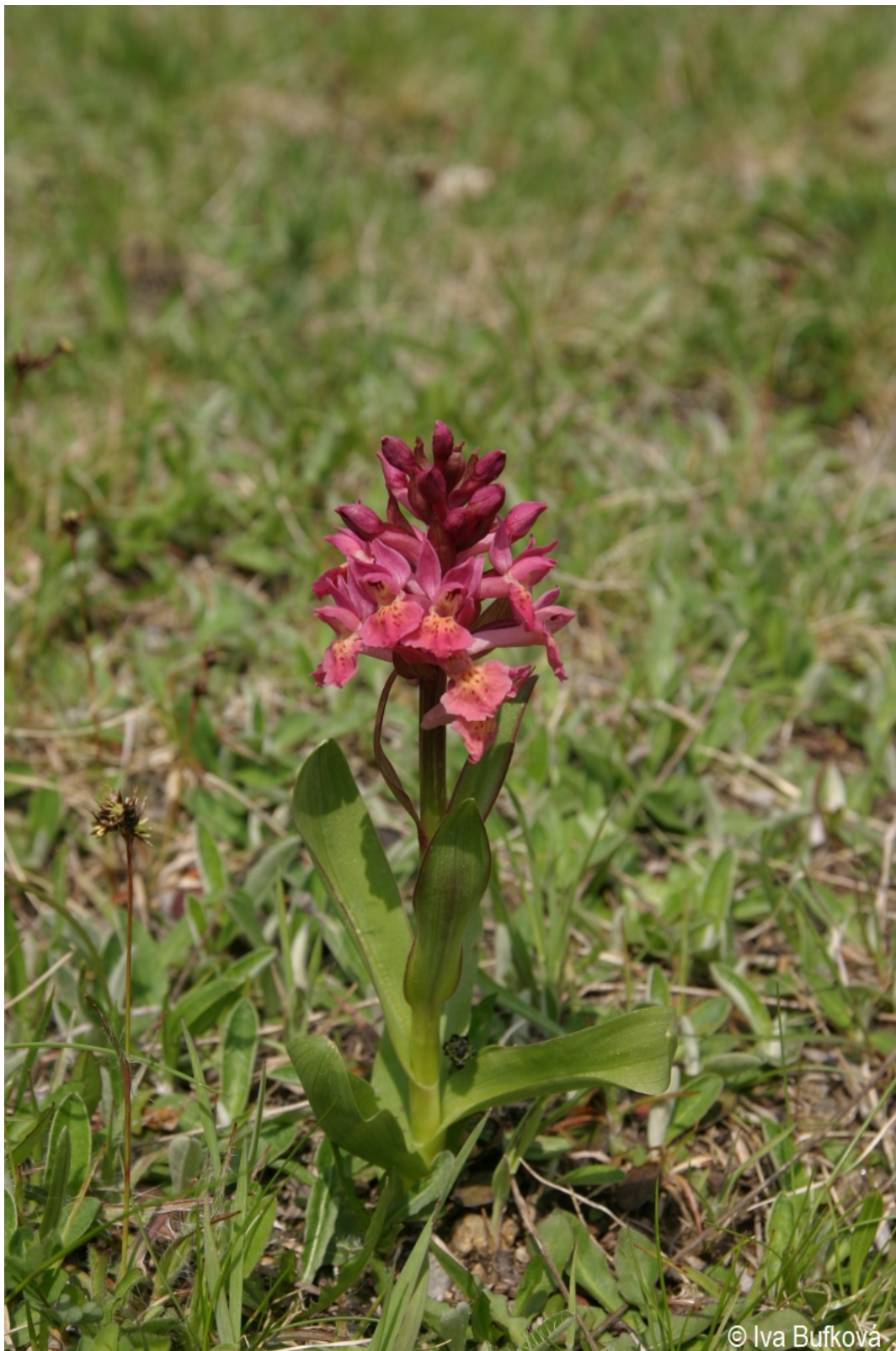
Dactylorhiza sambucina – Iva Bufková – Řetenice.