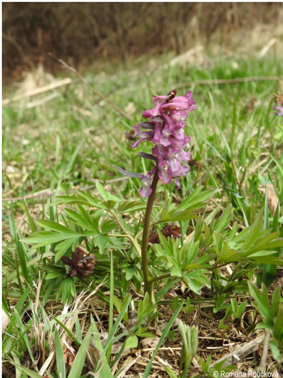
Corydalis cava – Romana Roučková – Peklo.