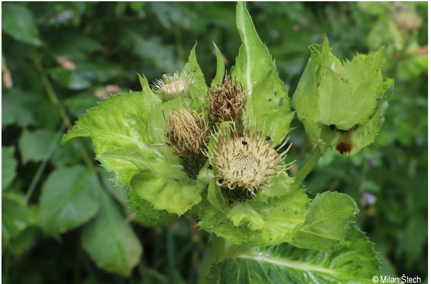
Cirsium oleraceum – Milan Štech – Bližná.