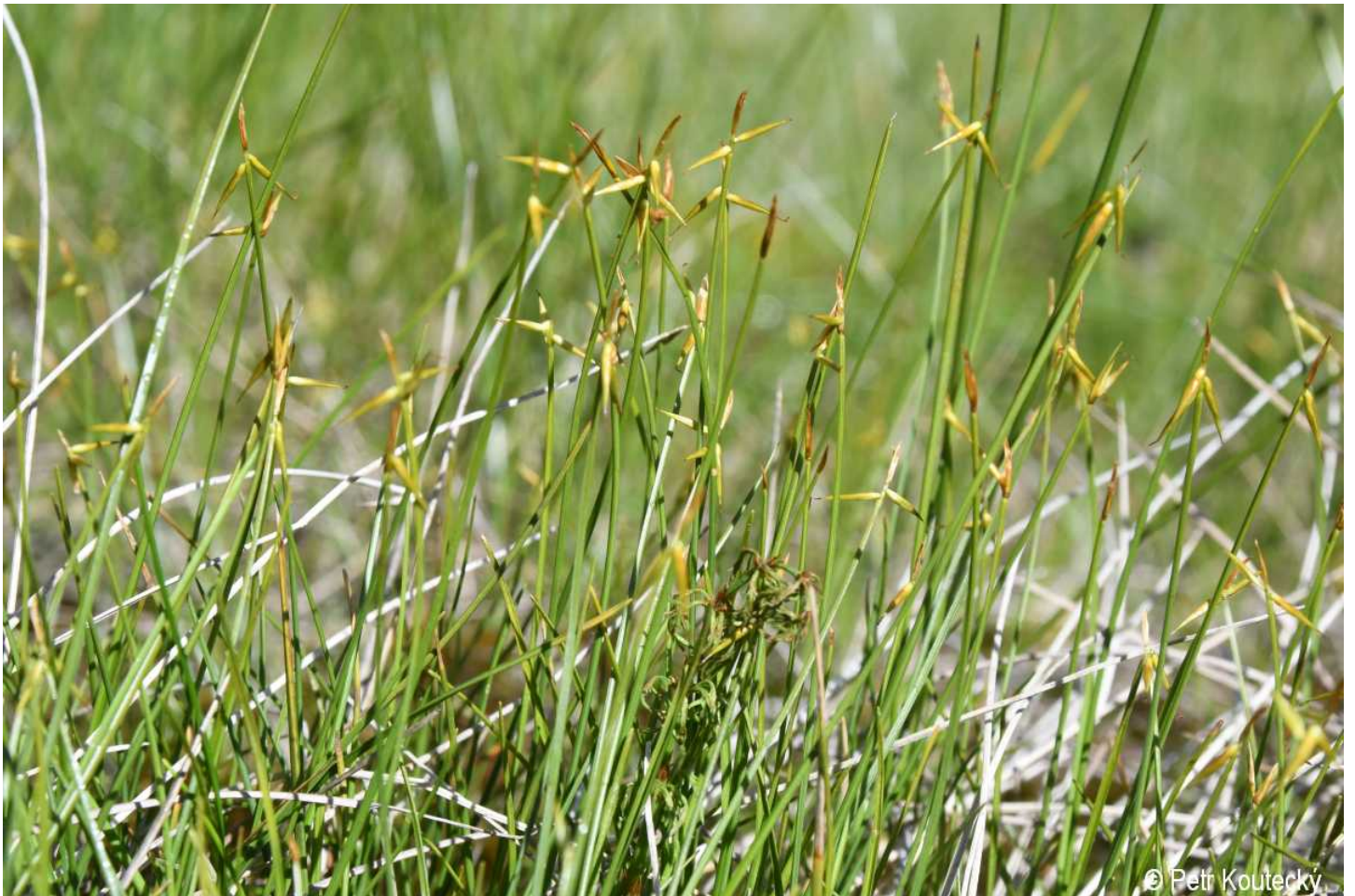
Carex pauciflora – Petr Koučeký – Březník.