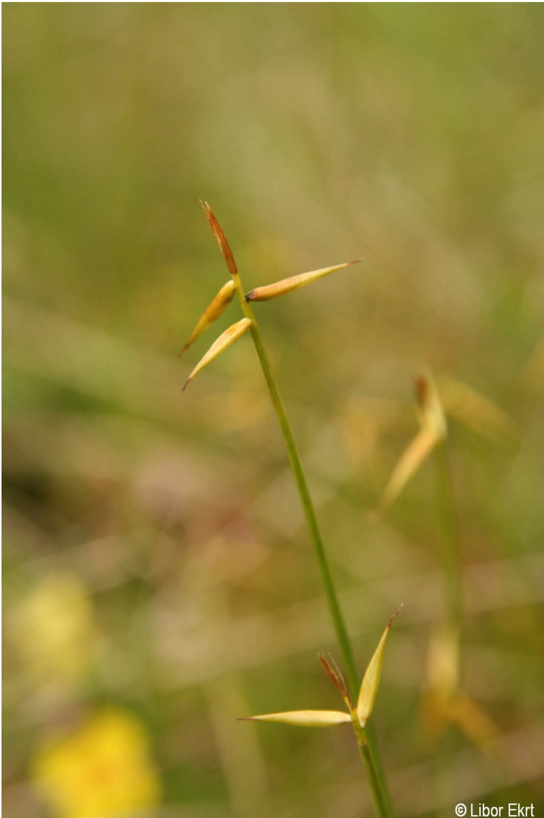
Carex pauciflora – Libor Ekrť – Kepelské Zhůří.