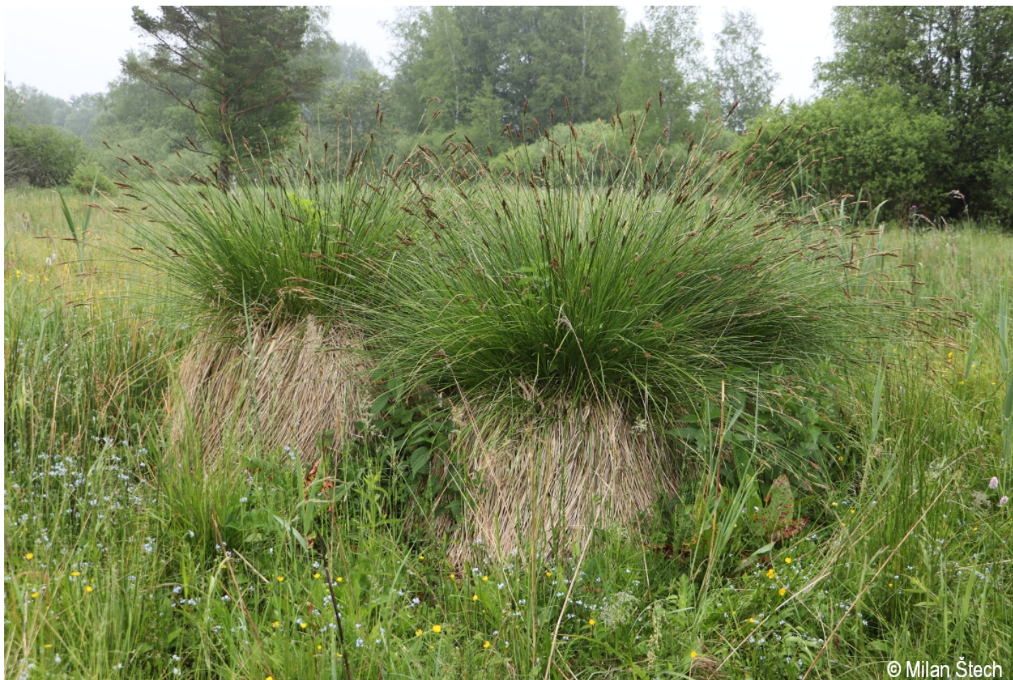
Carex paniculata – Milan Štech – Kyselov.