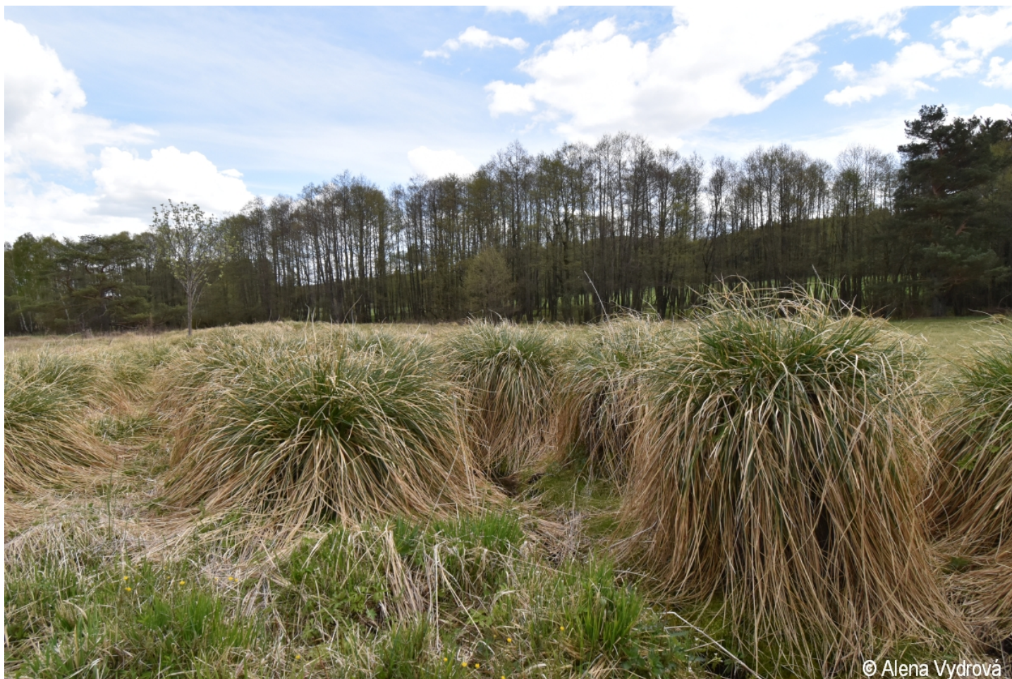
Carex paniculata – Alena Vydrová – Damič, Na Volešku.