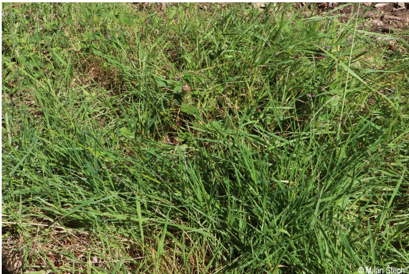
Agrostis stolonifera – Milan Štech – Stará Huť u Zhůří.