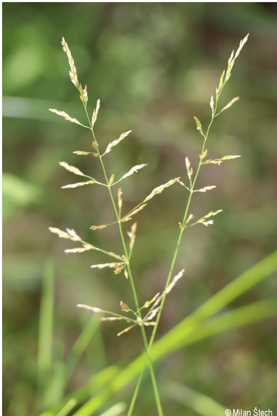
Agrostis stolonifera – Milan Štech – Stará Huť u Zhůří.