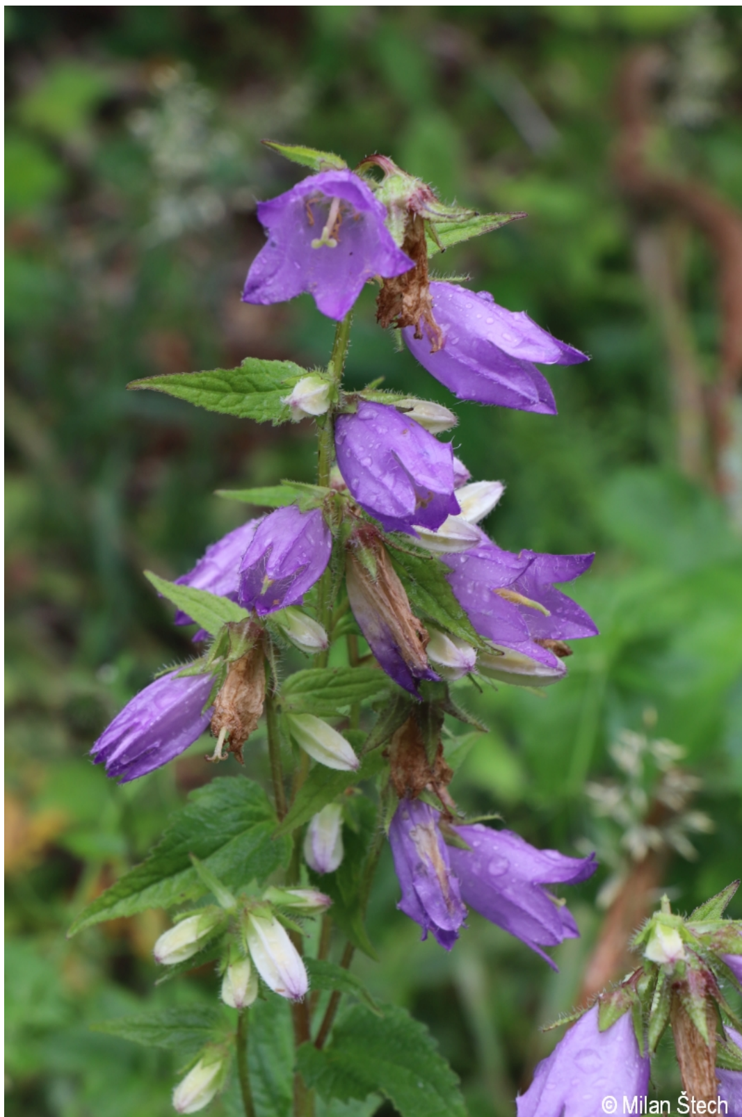
Campanula trachelium – Milan Štech – Černá v Pošumaví.