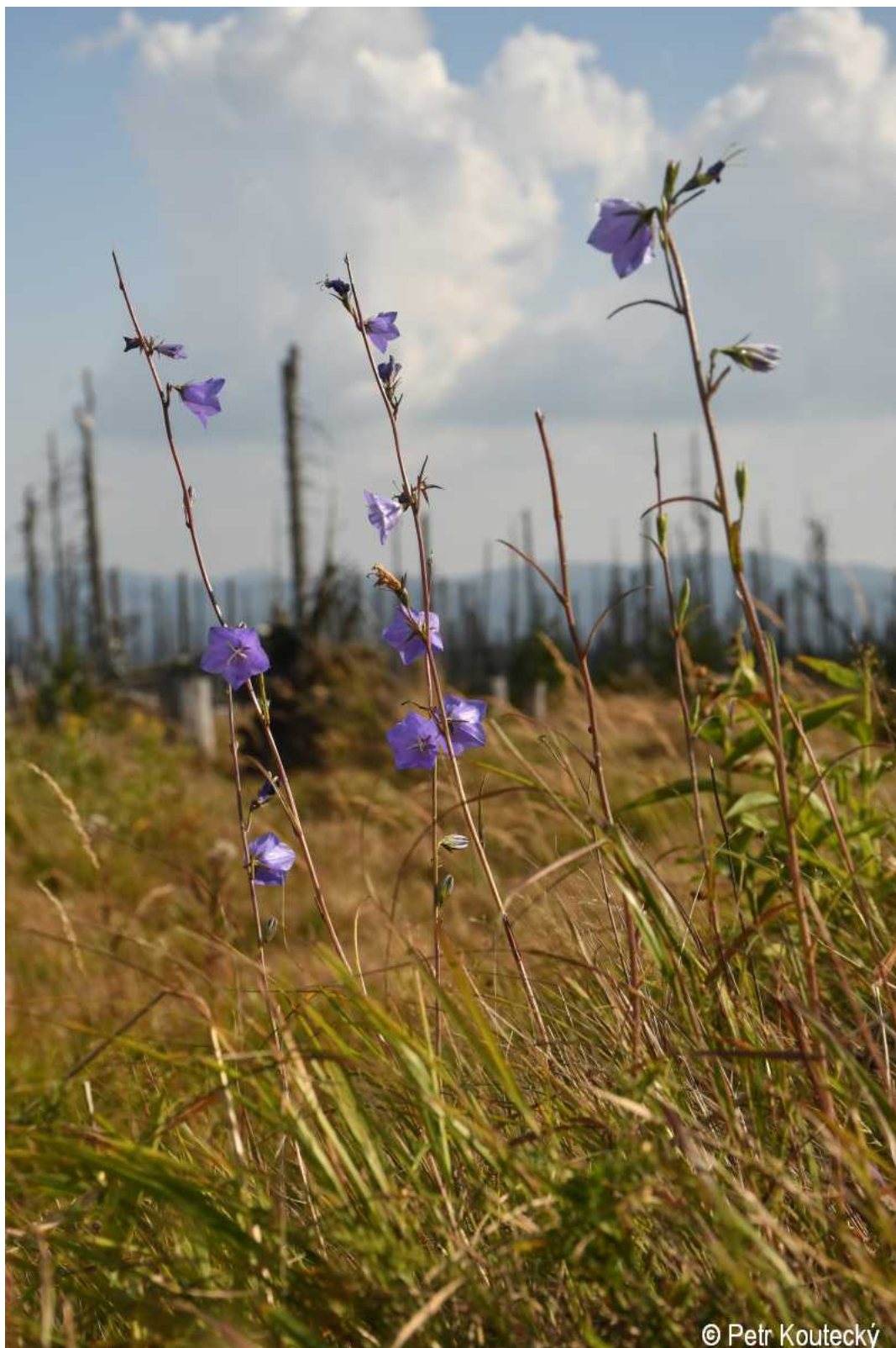
Campanula persicifolia – Petr Koutecký – Poledník.