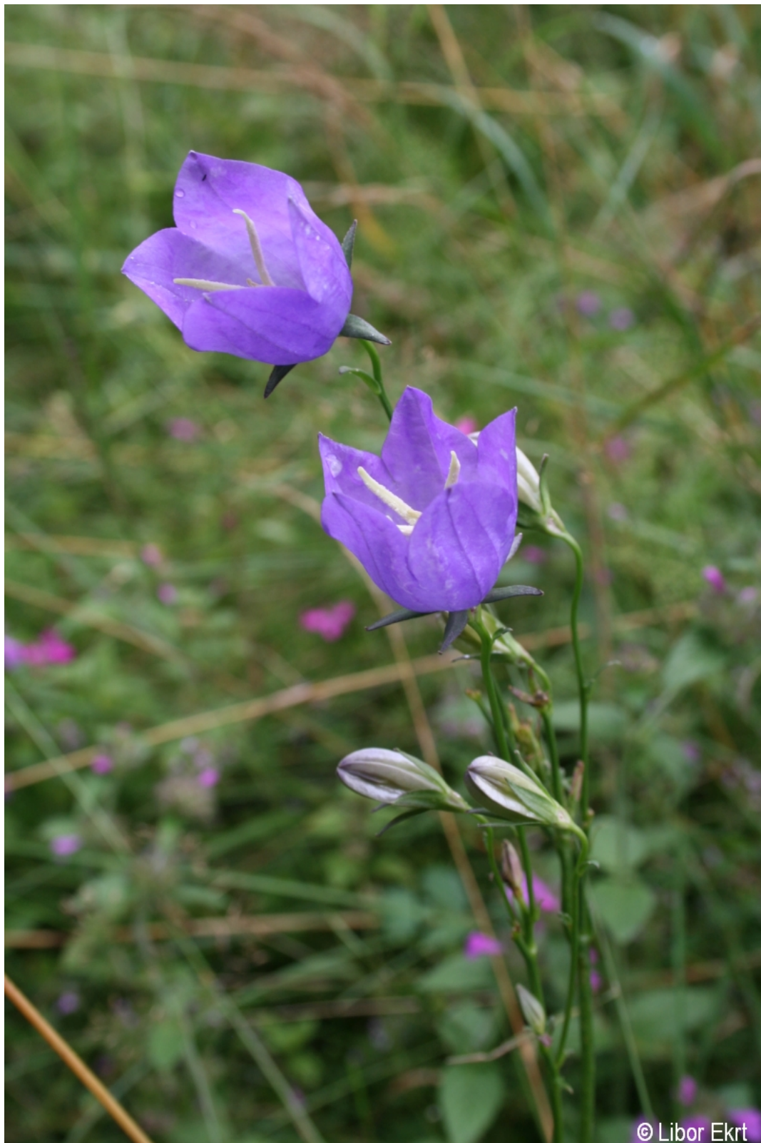
Campanula persicifolia – Libor Ekrť – Rejštejn.