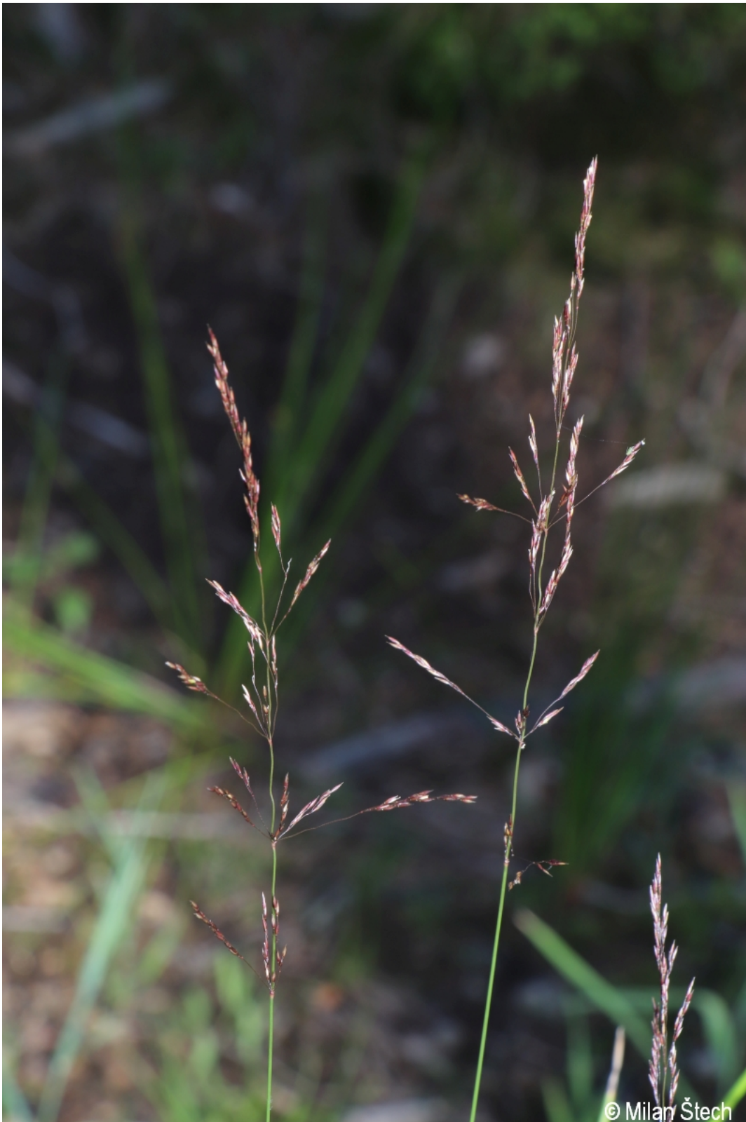
Agrostis canina – Milan Štech – Horská Kvilda, Stará Huť u Zhůří.