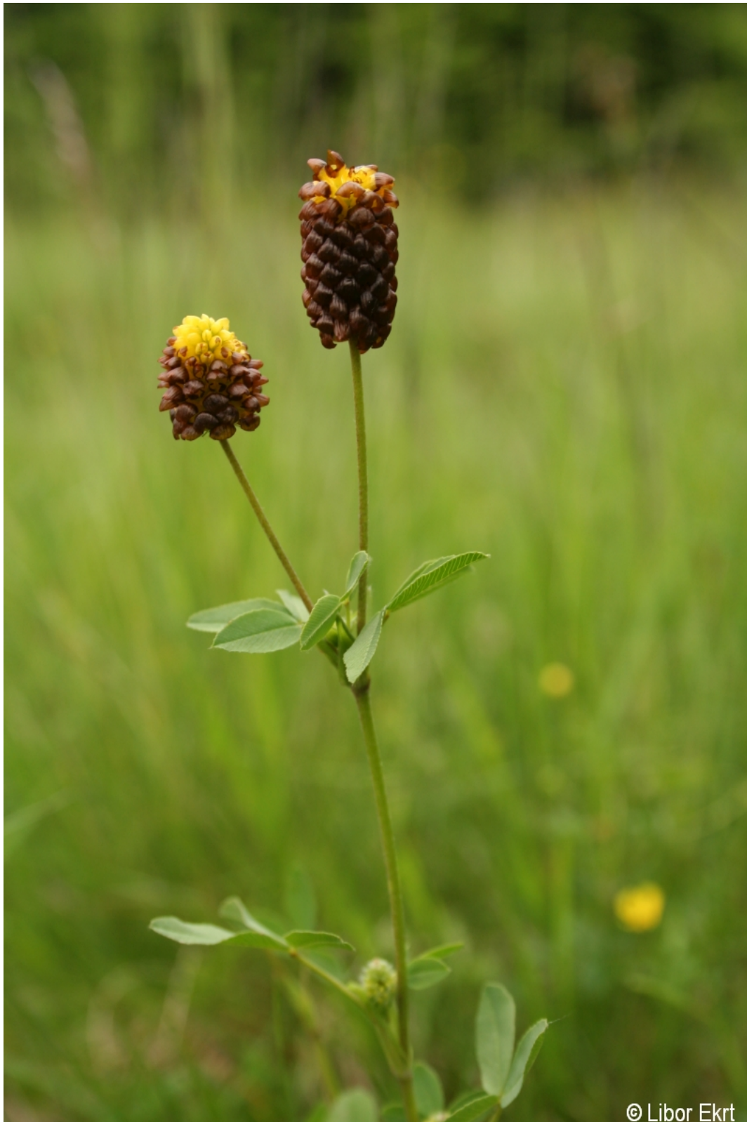
Trifolium spadiceum – Libor Ekrť – Kepelské Zhůří.