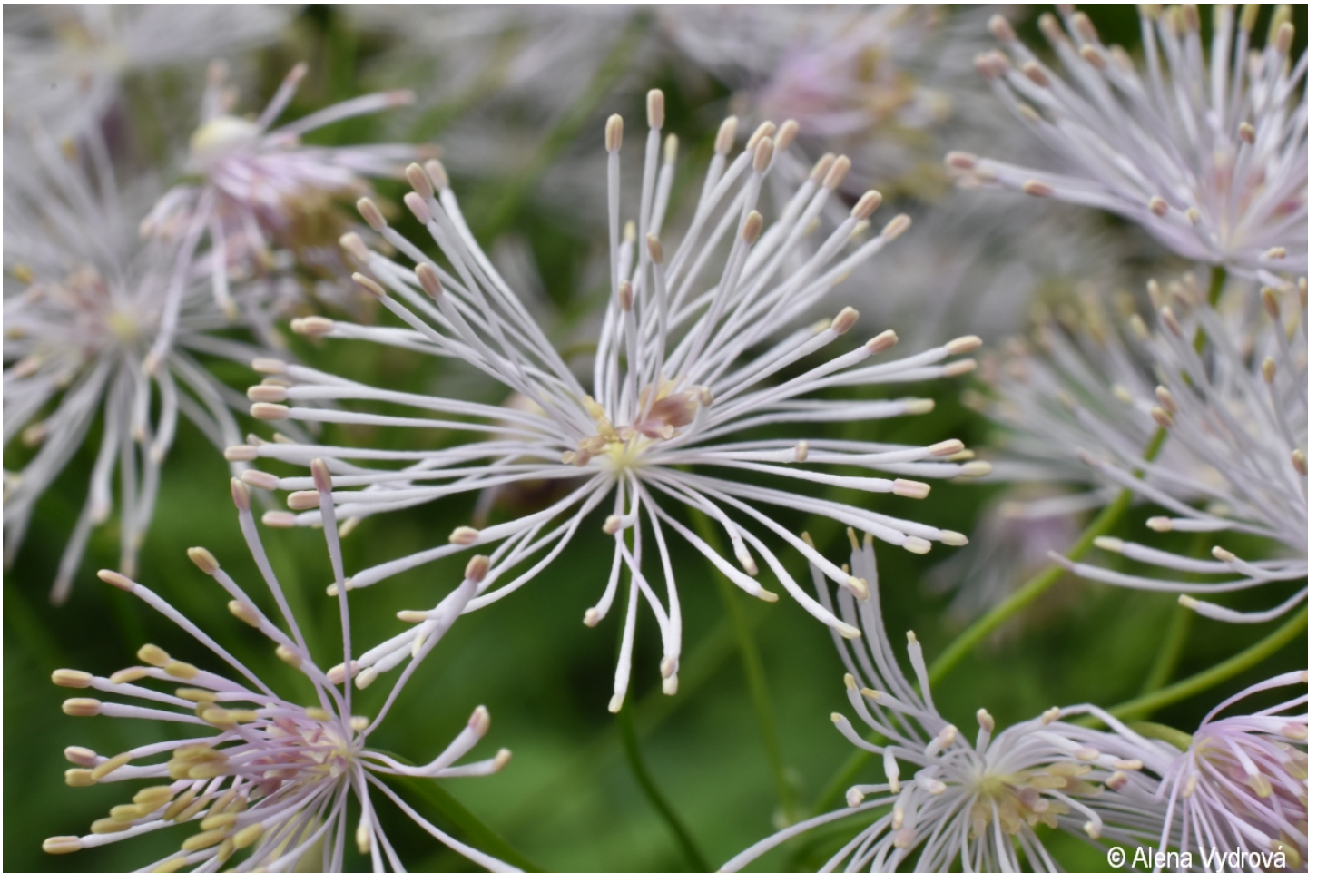
Thalictrum aquilegifolium – Alena Vydrová – Boletice.