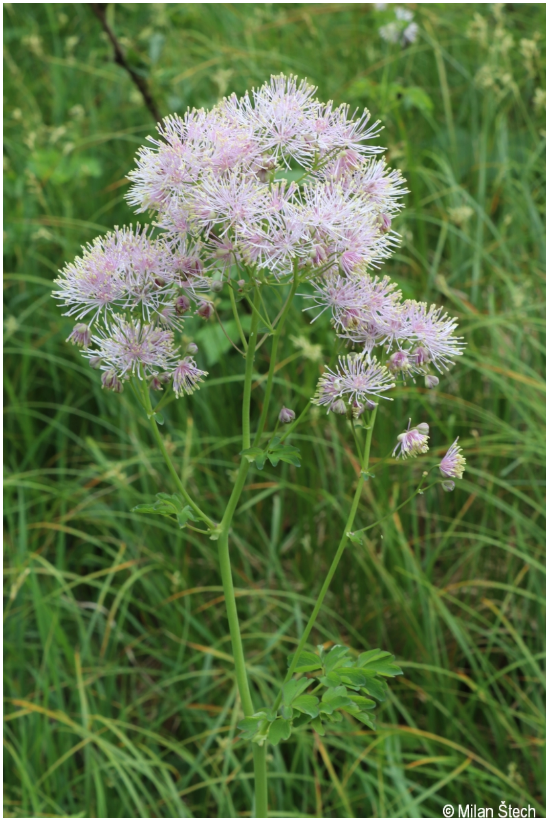
Thalictrum aquilegifolium – Milan Štech – Schnellenzipf.