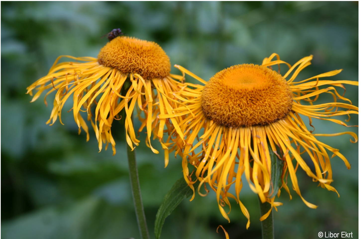
Telekia speciosa – Libor Ekrt – České Žleby.