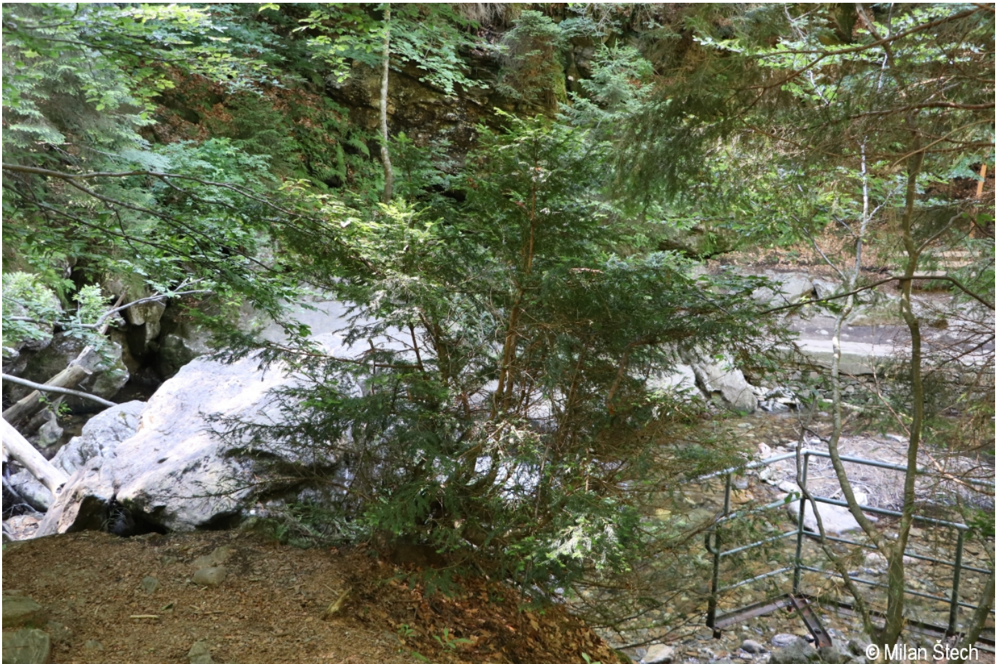
Taxus baccata – Milan Štech – Riesloch.