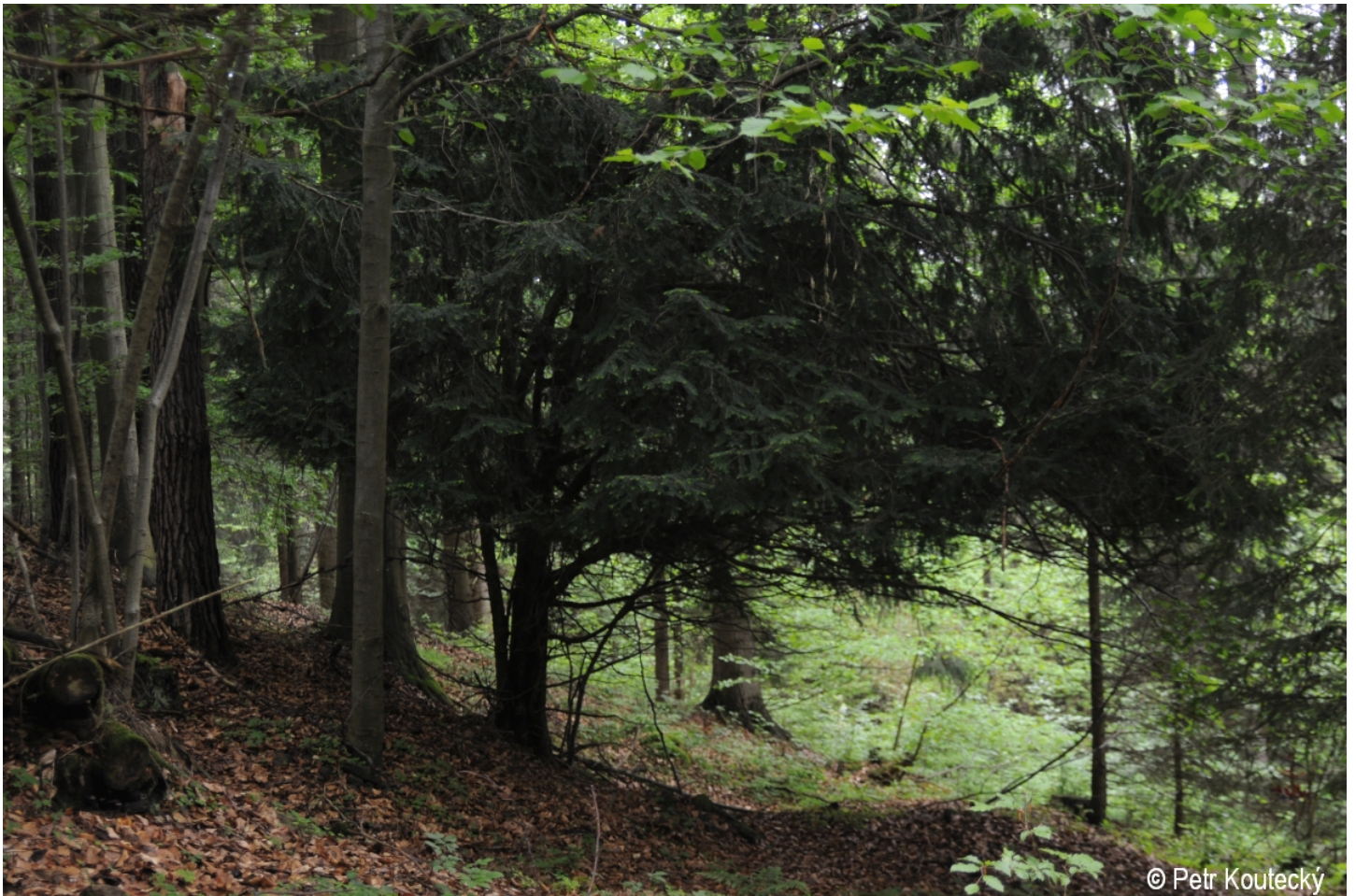
Taxus baccata – Petr Koučeký – Ktiš.