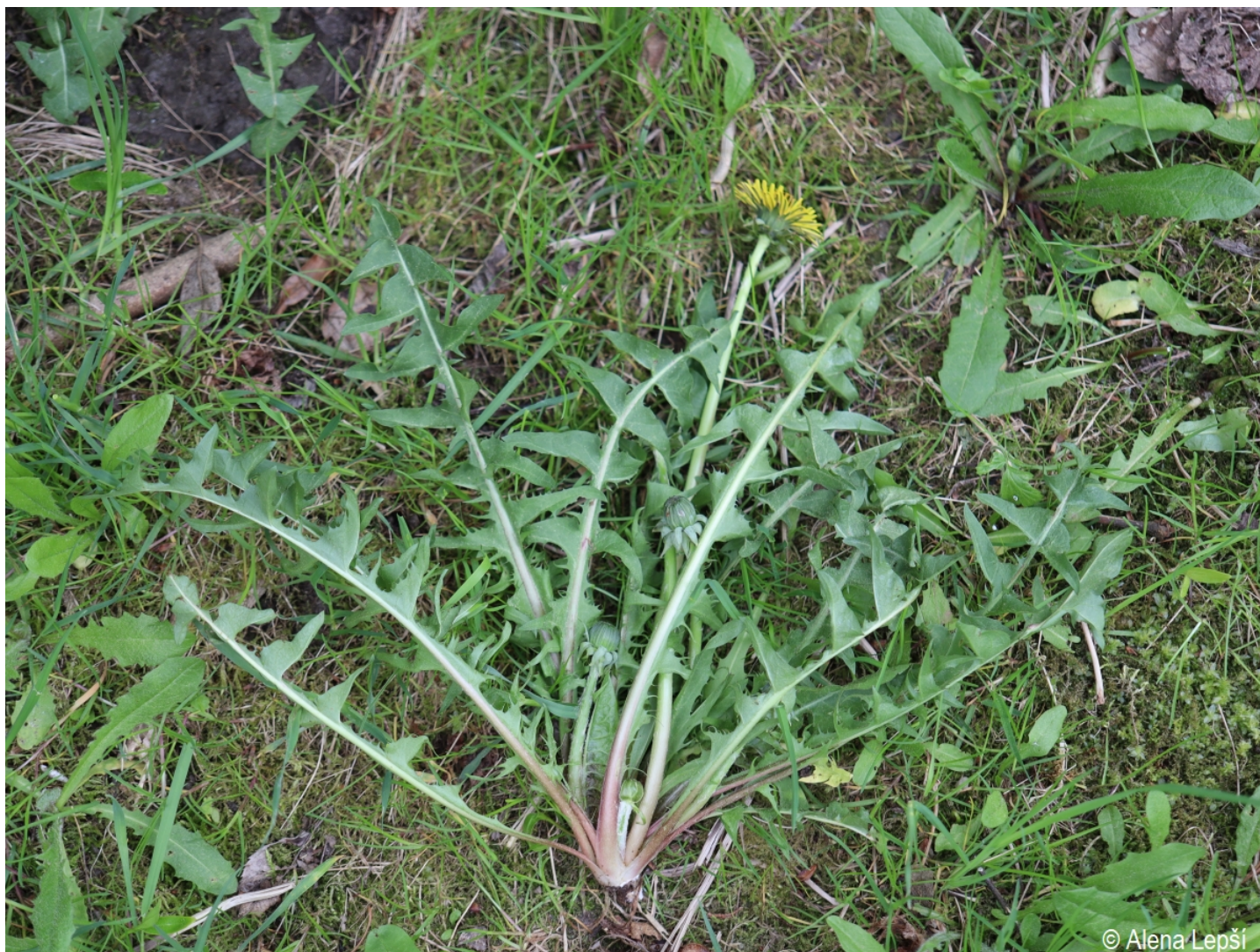
Taraxacum jugiferum – Alena Lepší – Hartmanice.