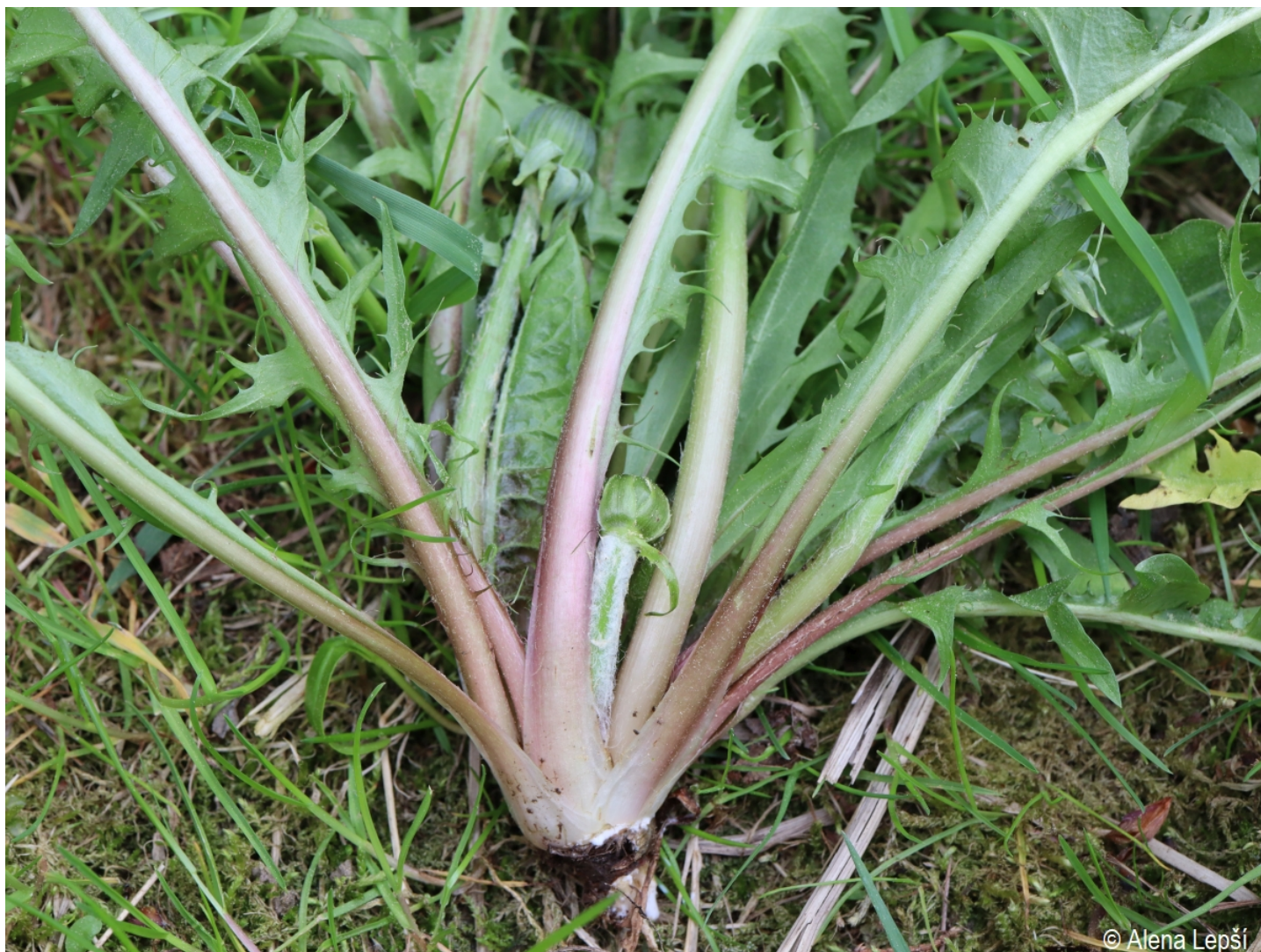
Taraxacum jugiferum – Alena Lepší – Hartmanice.