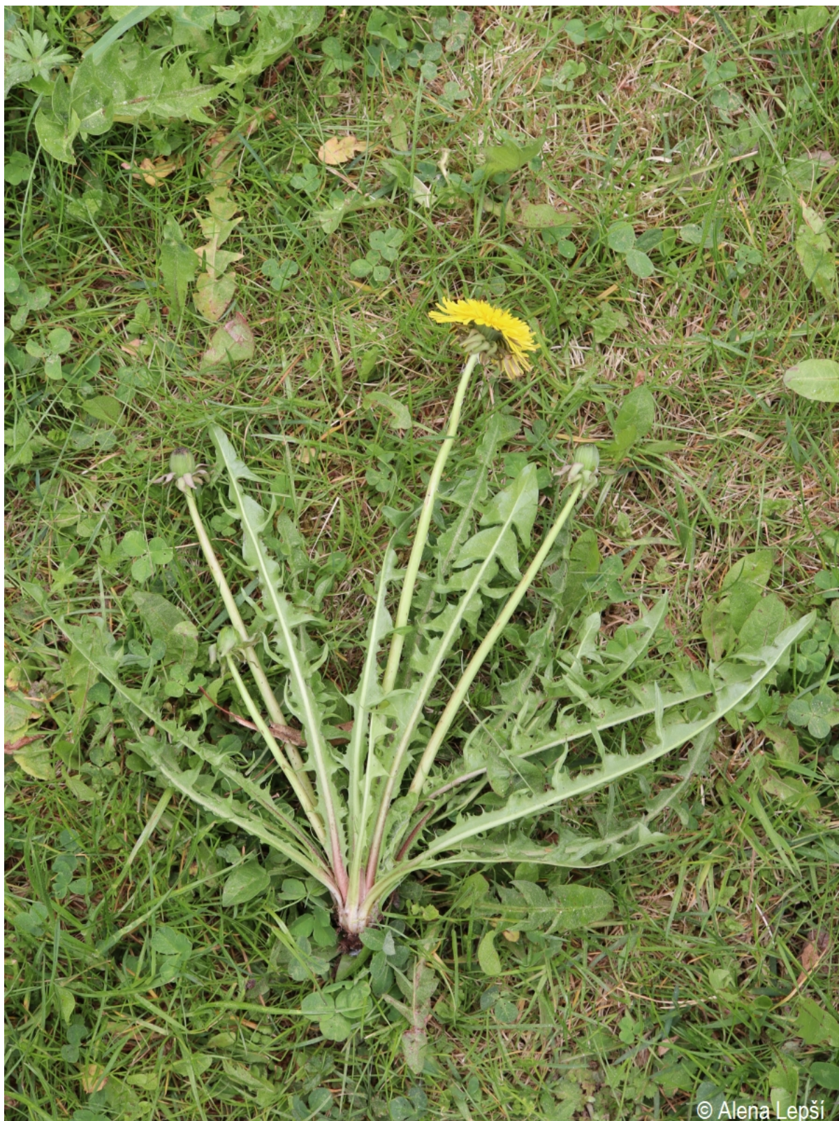
Taraxacum exsertiforme – Alena Lepší – Hartmanice.