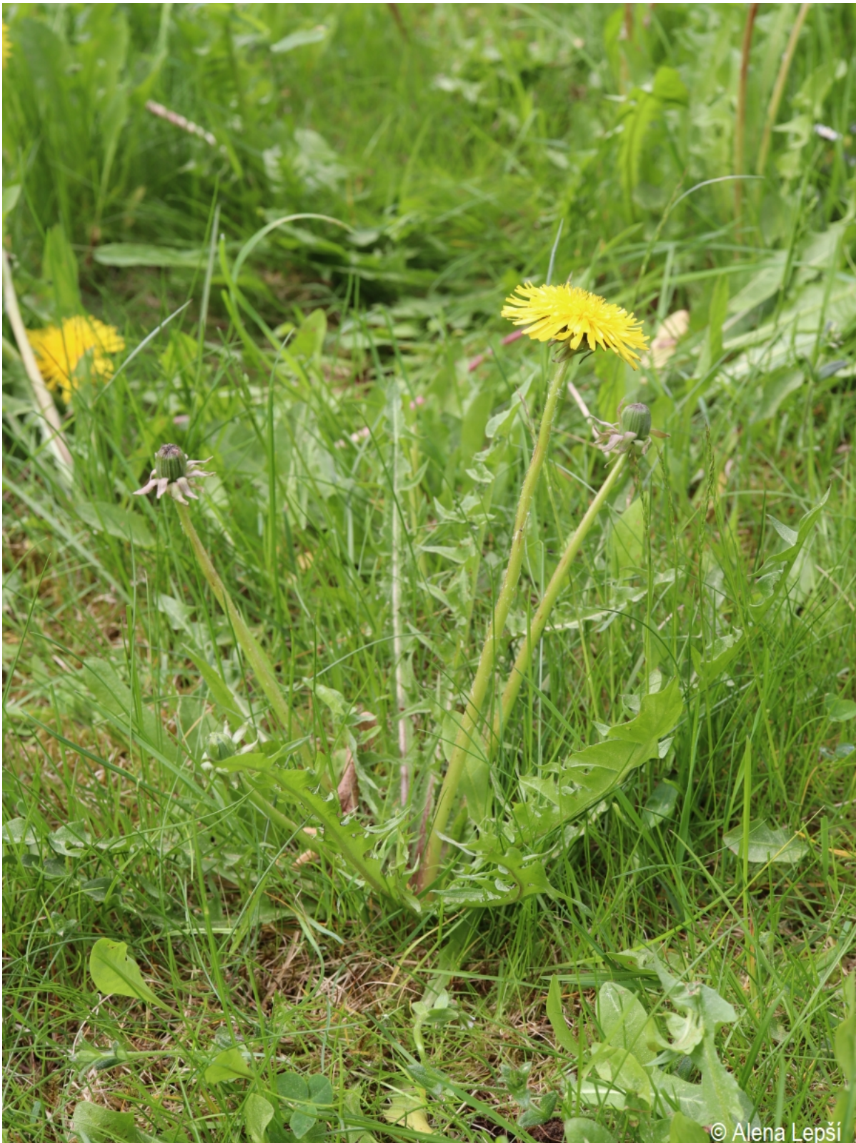
Taraxacum exsertiforme – Alena Lepší – Hartmanice.