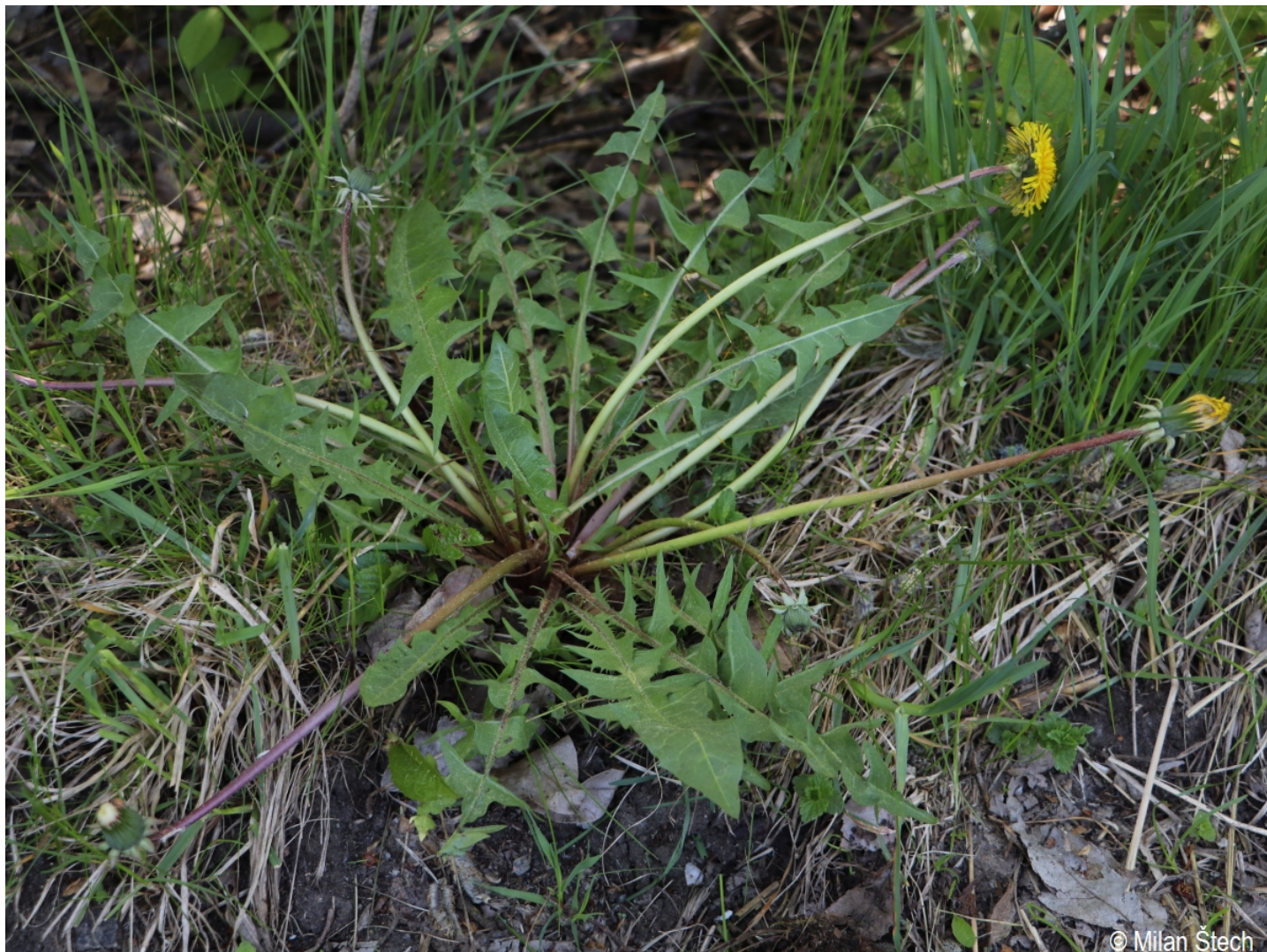
Taraxacum elegantius – Milan Štech – Březovík.