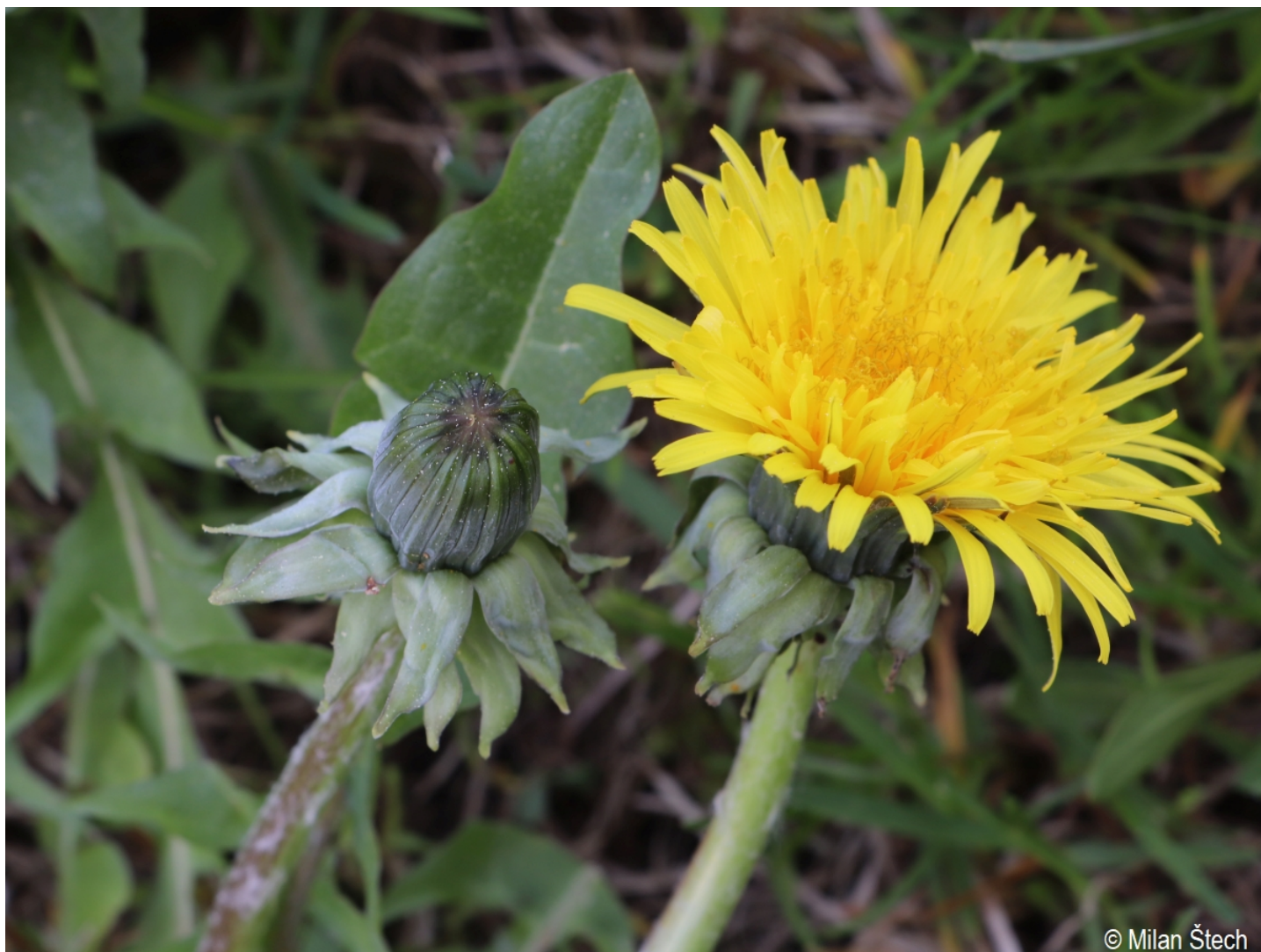
Taraxacum crassum – Milan Štech – Volary.