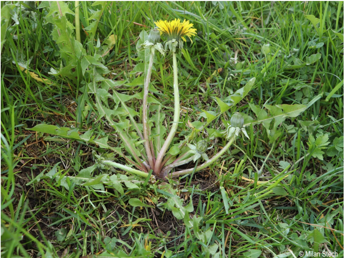
Taraxacum crassum – Milan Štech – Volary.