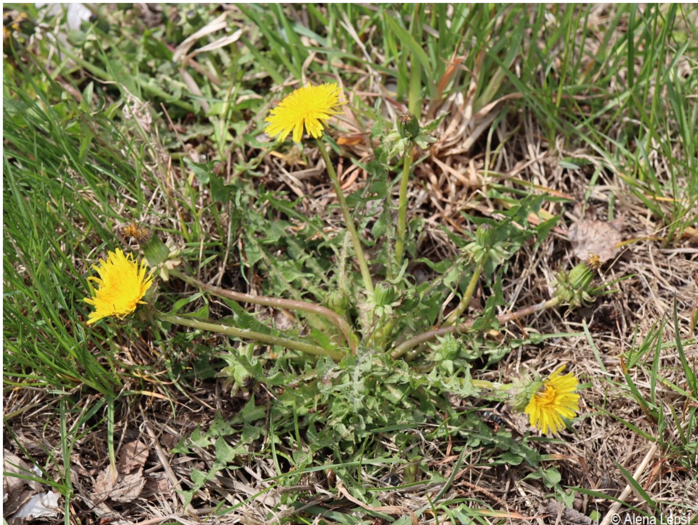
Taraxacum acroglossum – Alena Lepší – Železná Ruda.