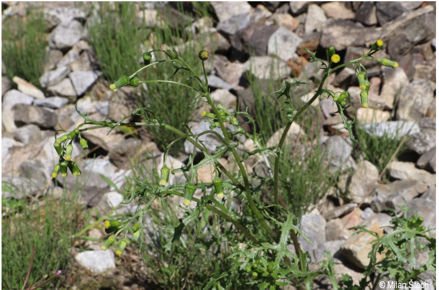
Senecio vulgaris – Milan Štech – Olšina.