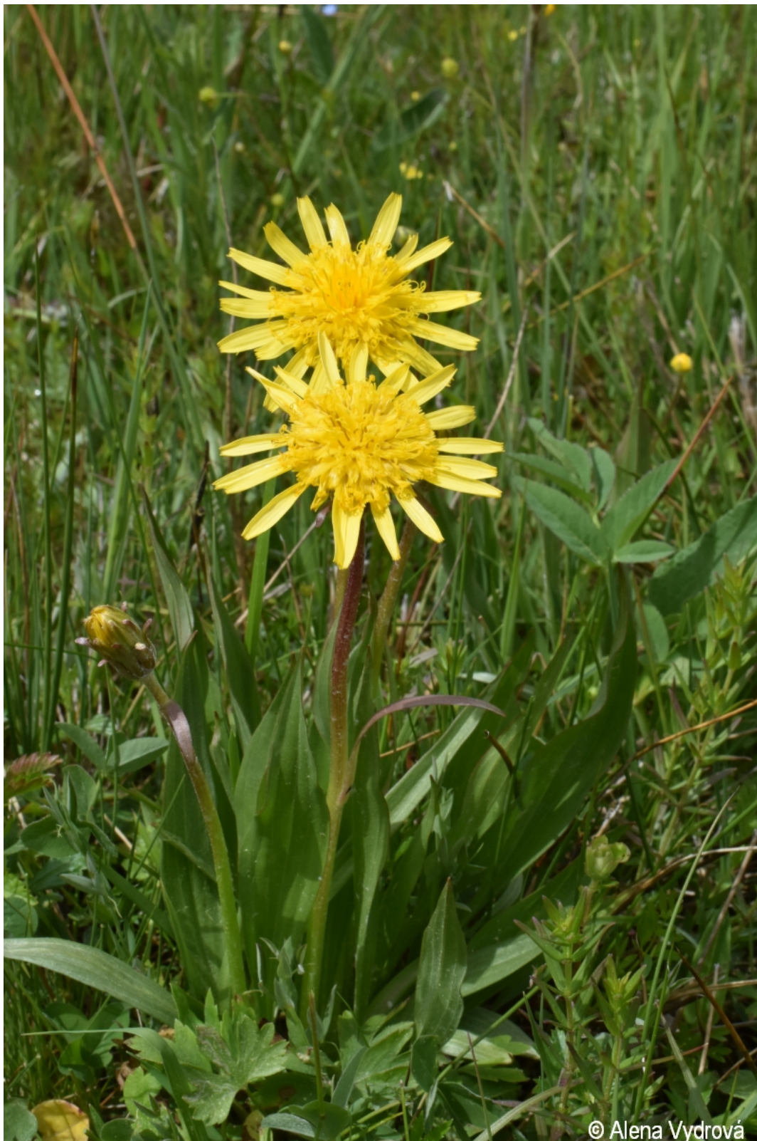
Scorzonera humilis – Alena Vydrová – Boletice.