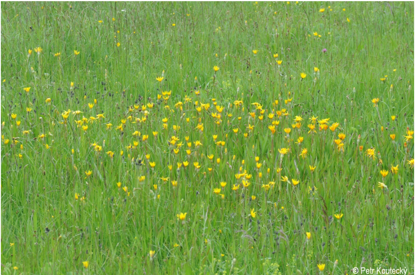
Scorzonera humilis – Petr Koutecký – Dolní Sněžná.