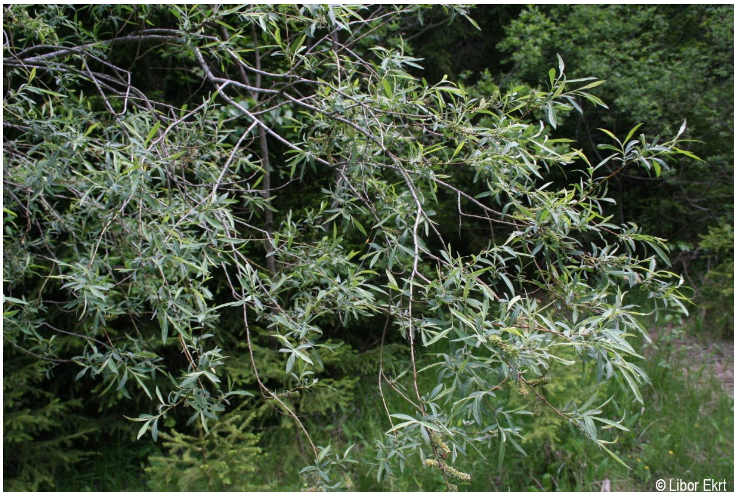
Salix purpurea – Libor Ekrt – Modrava.