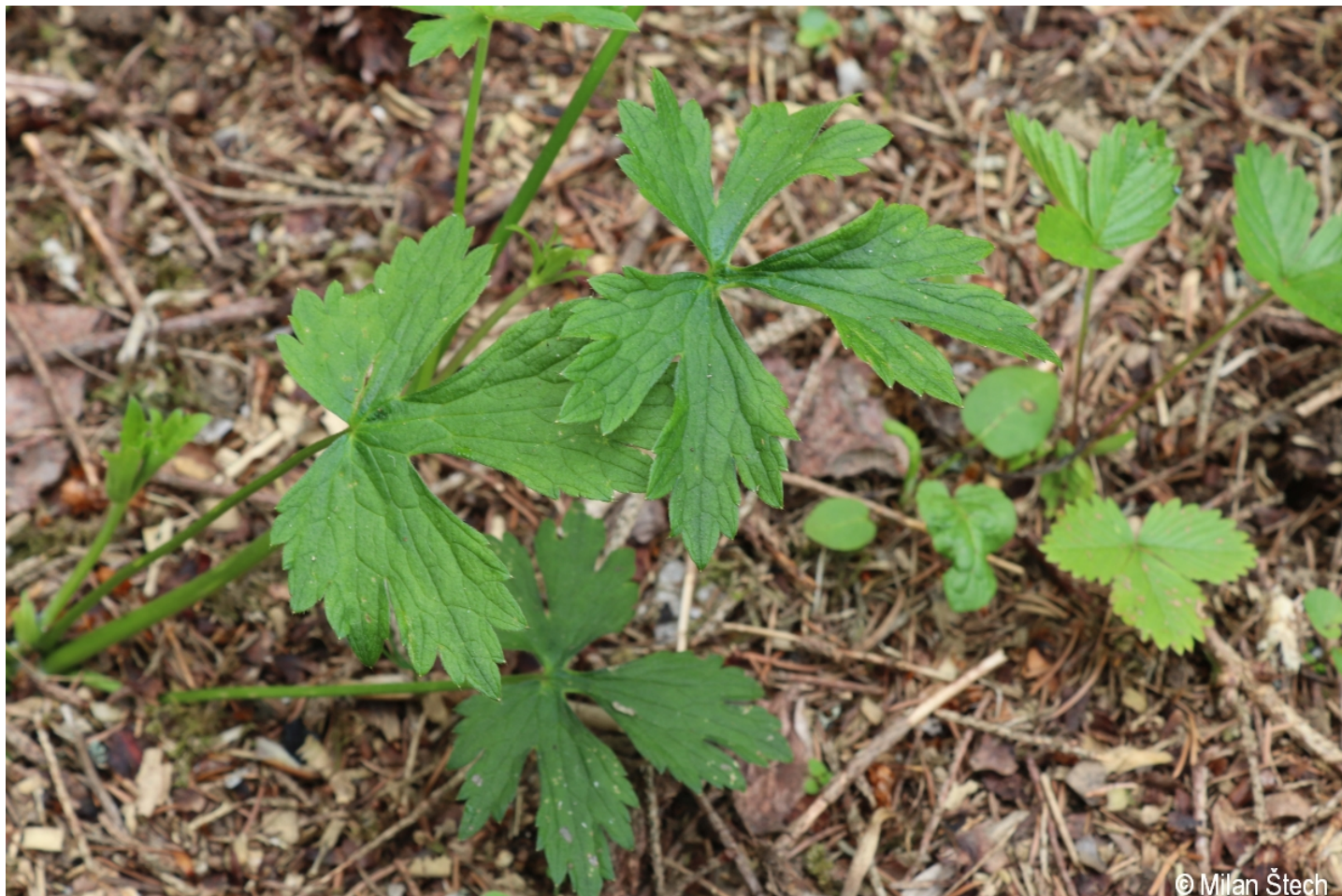
Ranunculus nemorosus – Milan Štech – Olšina, Suchý vrch.