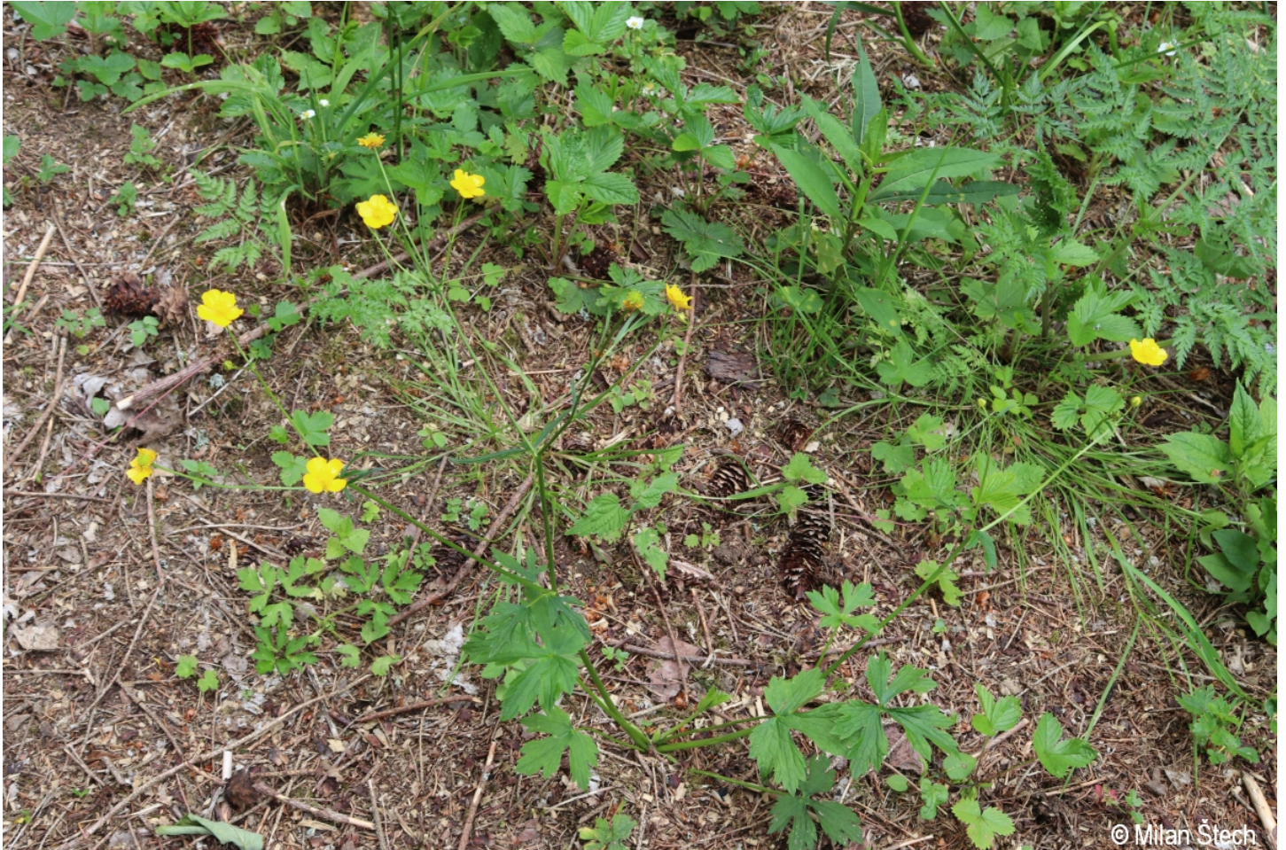
Ranunculus nemorosus – Milan Štech – Olšina, Suchý vrch.