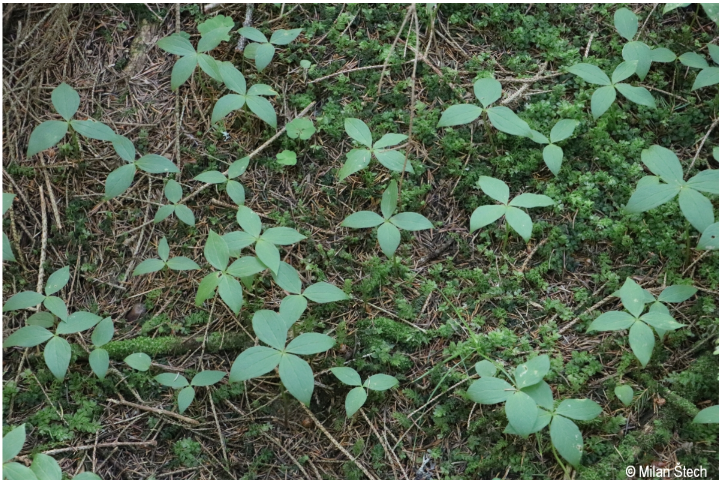
Paris quadrifolia – Milan Štech – Horská Kvilda, Stará Huť u Zhůří.