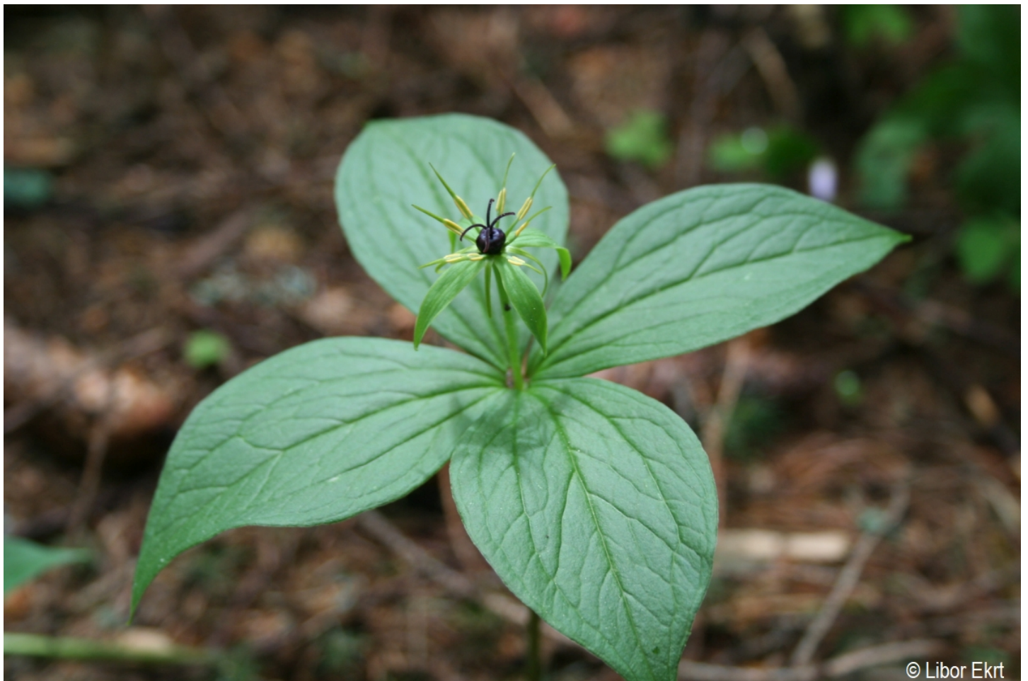
Paris quadrifolia – Libor Ekrť – Horní Sněžná.