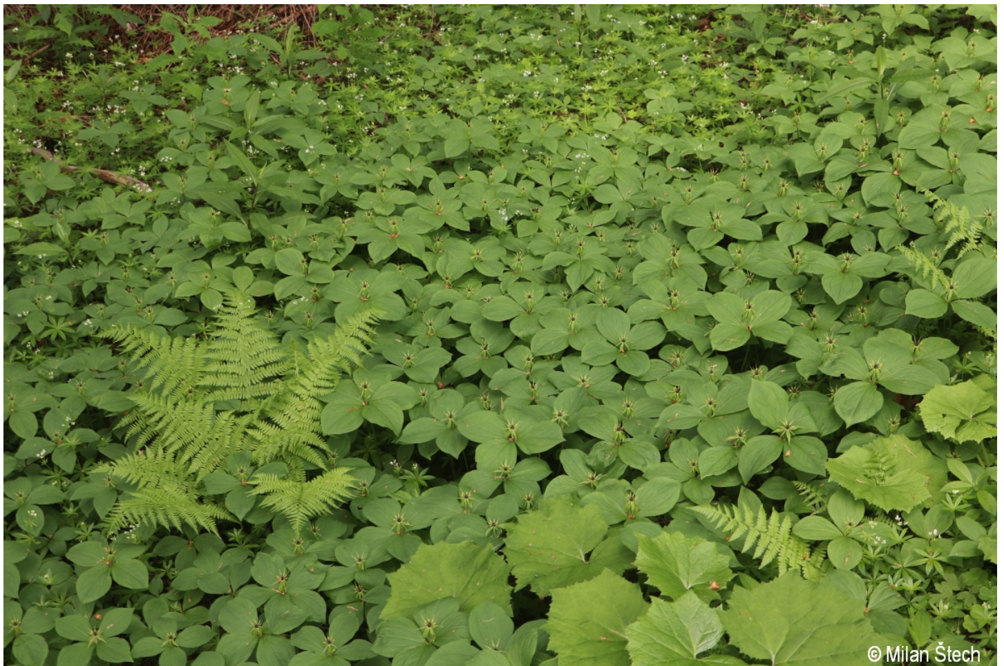
Paris quadrifolia – Milan Štech – Rejštejnské Zhůří.