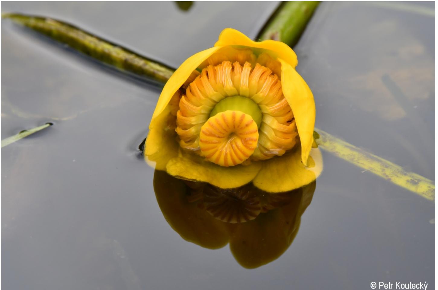
Nuphar lutea – Petr Koučeký – Dobrá, Vltavský luh.