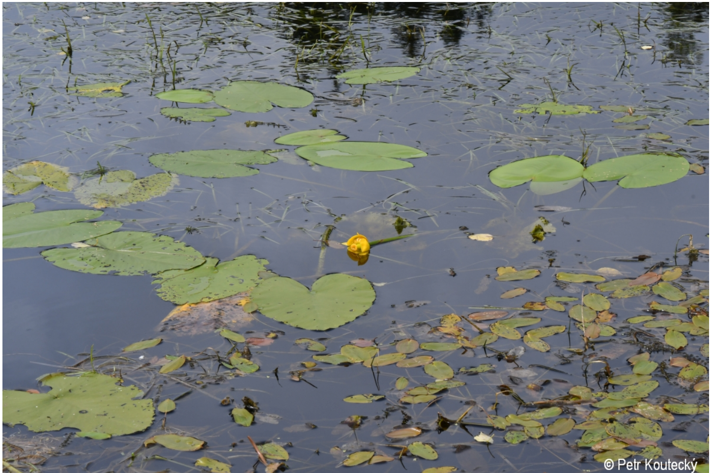
Nuphar lutea – Petr Koutecký – Dobrá, Vltavský luh.