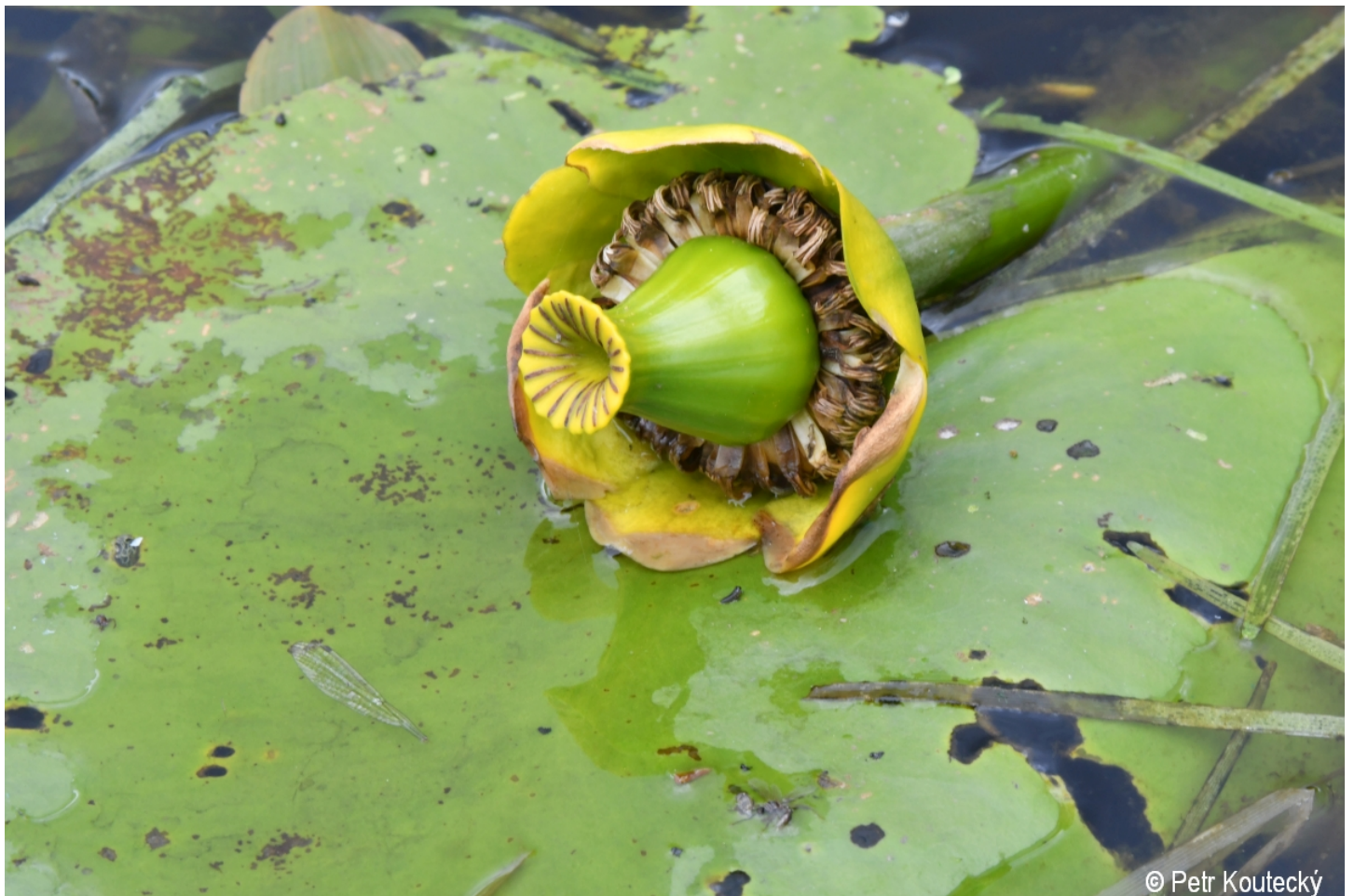
Nuphar lutea – Petr Koučeký – Dobrá, Vltavský luh.