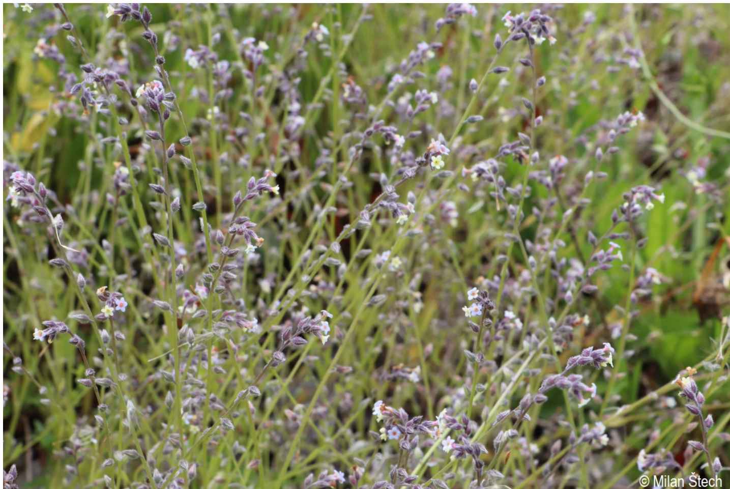
Myosotis discolor – Milan Štech – Horní Planá, Staré Hutě.