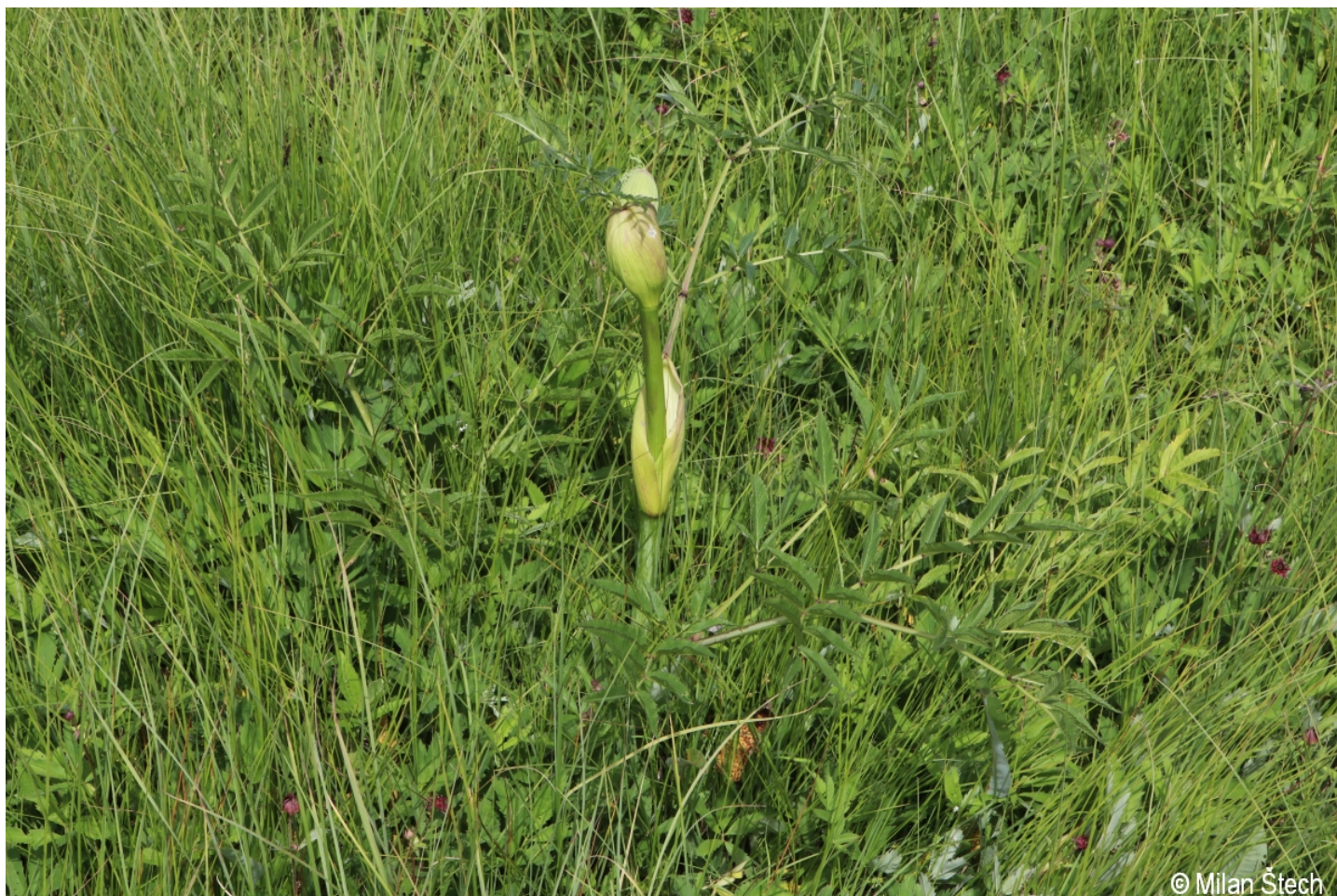
Angelica sylvestris – Milan Štech – Kvilda.