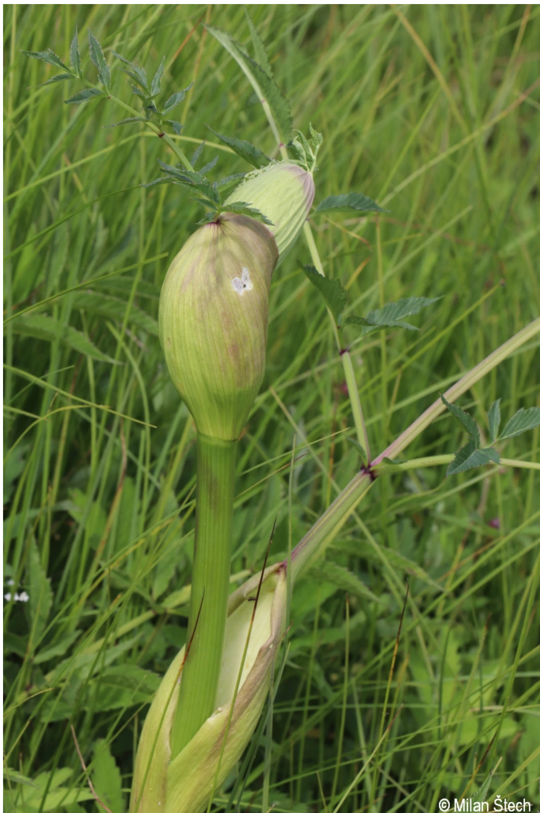
Angelica sylvestris – Milan Štech – Kvilda.