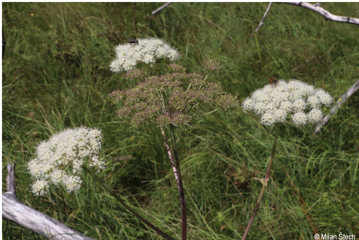
Angelica sylvestris – Milan Štech – Strážný.