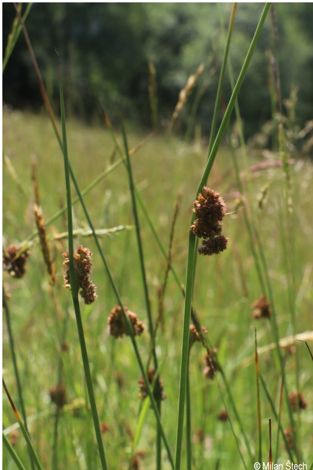
Juncus conglomeratus – Milan Štech – Svojše.