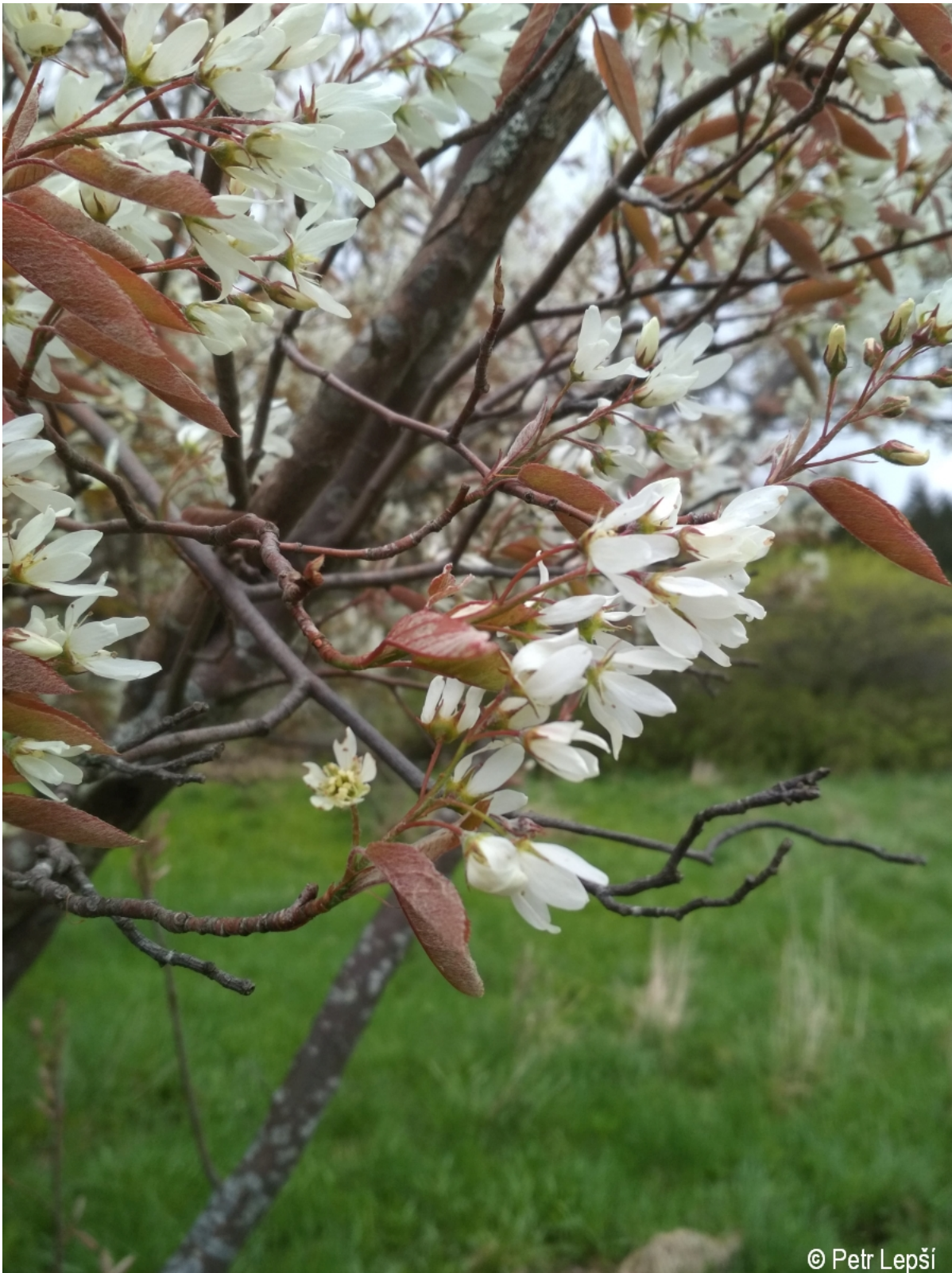
Amelanchier lamarckii – Petr Lepší – býv. Květná.