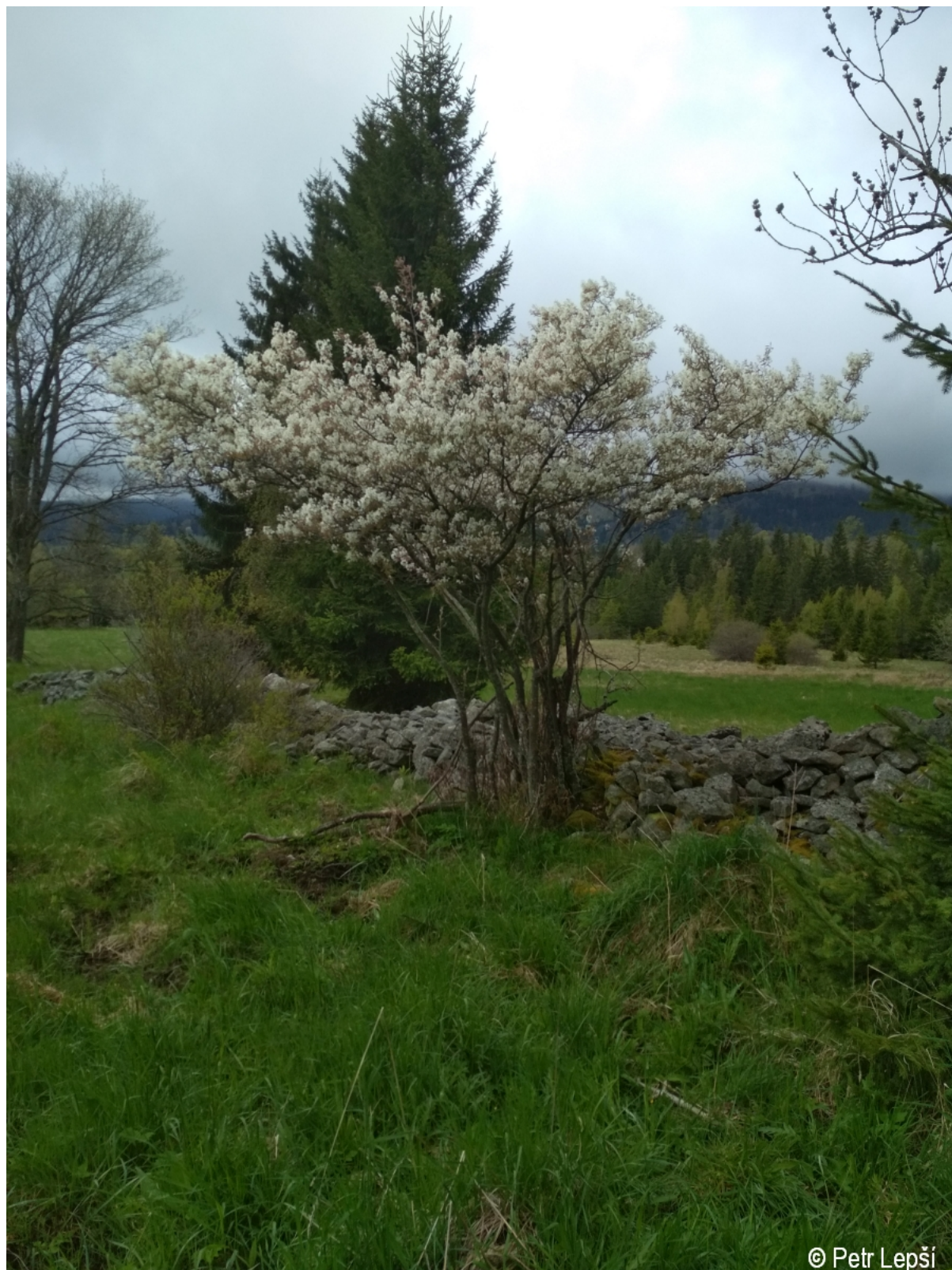
Amelanchier lamarckii – Petr Lepší – býv. Květná.