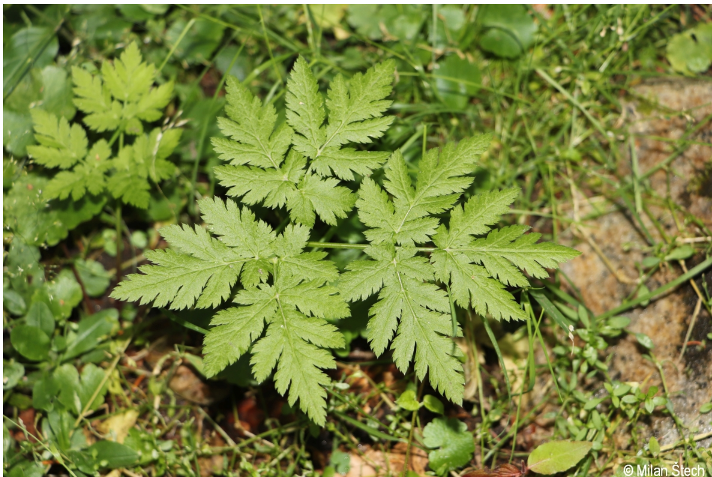
Chaerophyllum hirsutum – Milan Štech – Horská Kvilda, Stará Huť u Zhůří.