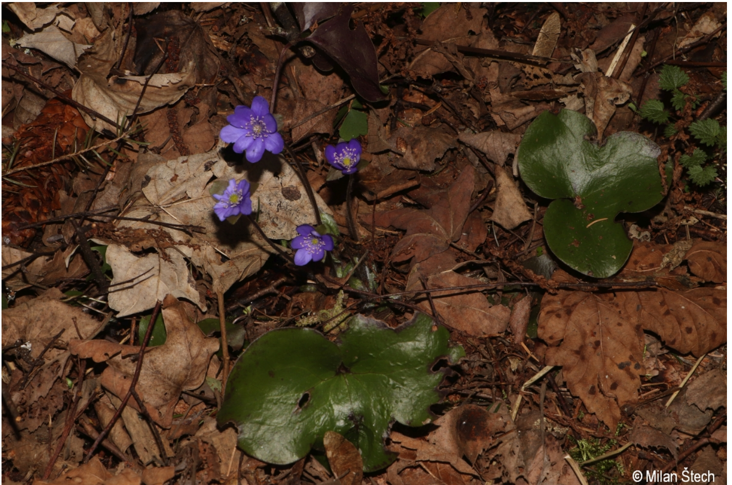
Hepatica nobilis – Milan Štech – Hartmanice.