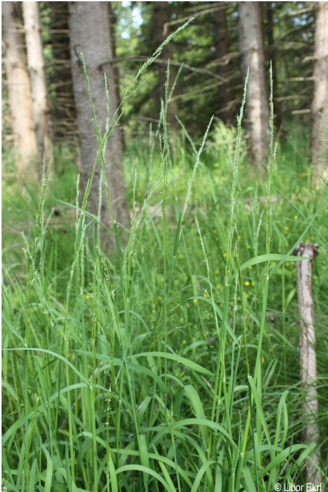
Glyceria fluitans – Libor Ekrť – Házlův kříž.