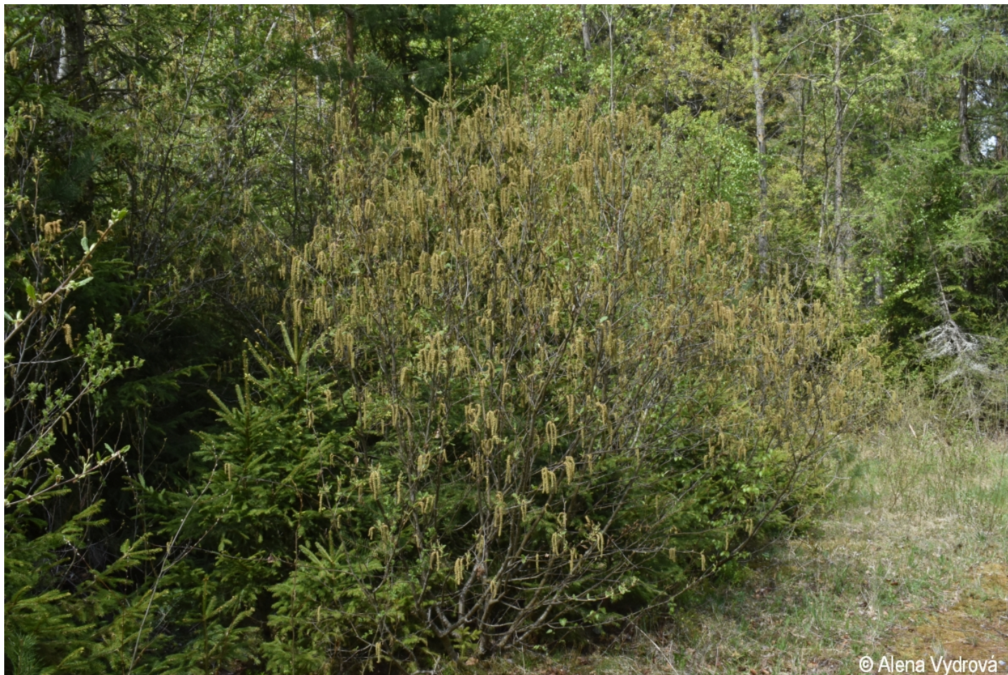
Alnus alnobetula – Alena Vydrová – Studánky, pod Hradištěm .