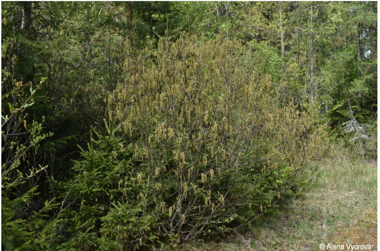
Alnus alnobetula – Alena Vydrová – Studánky, pod Hradištěm .