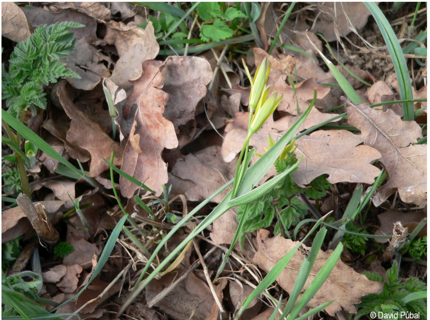
Gagea pratensis – David Půbal – Šumavské Hoštice.