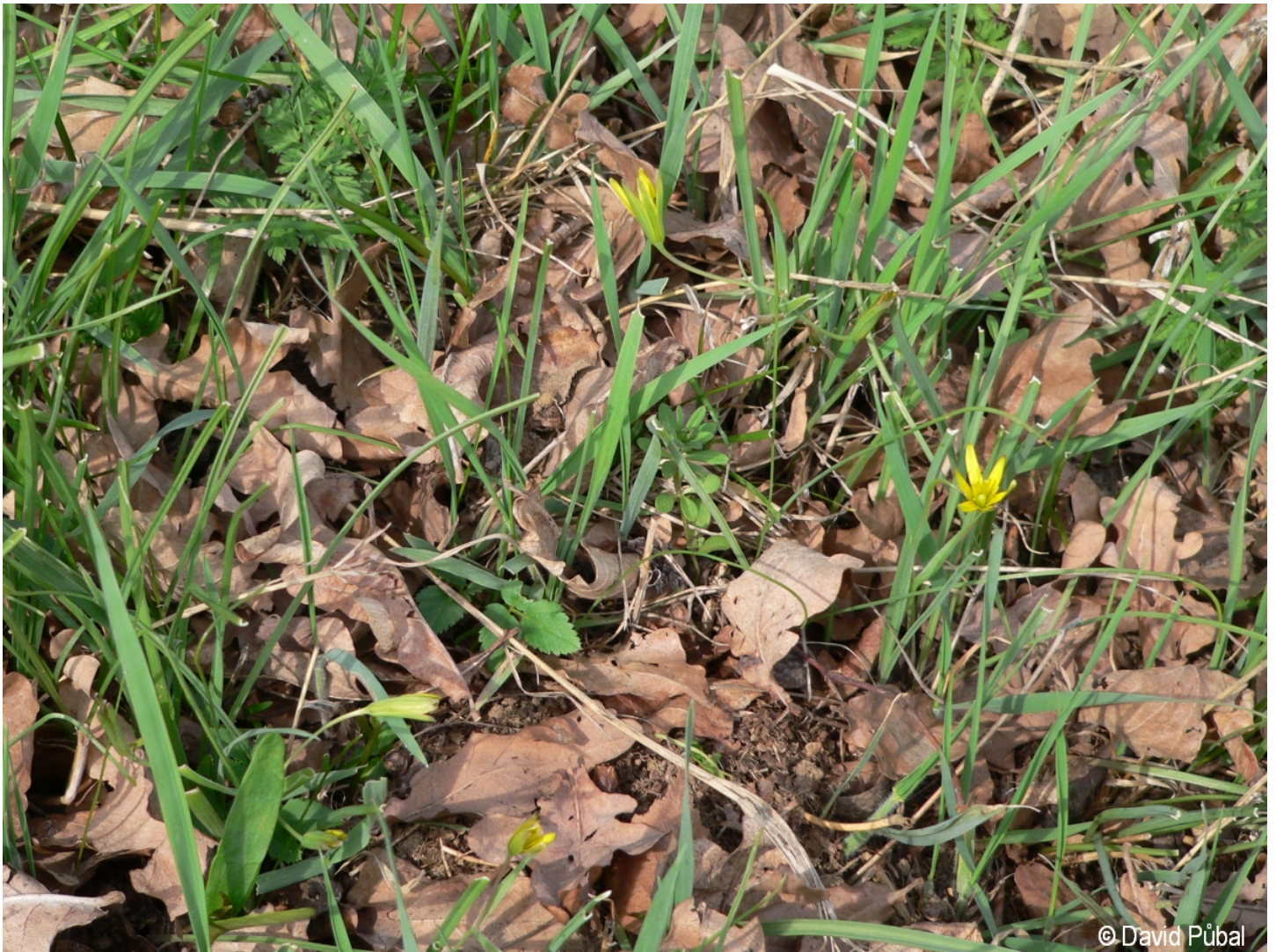
Gagea pratensis – David Půbal – Šumavské Hořtice.