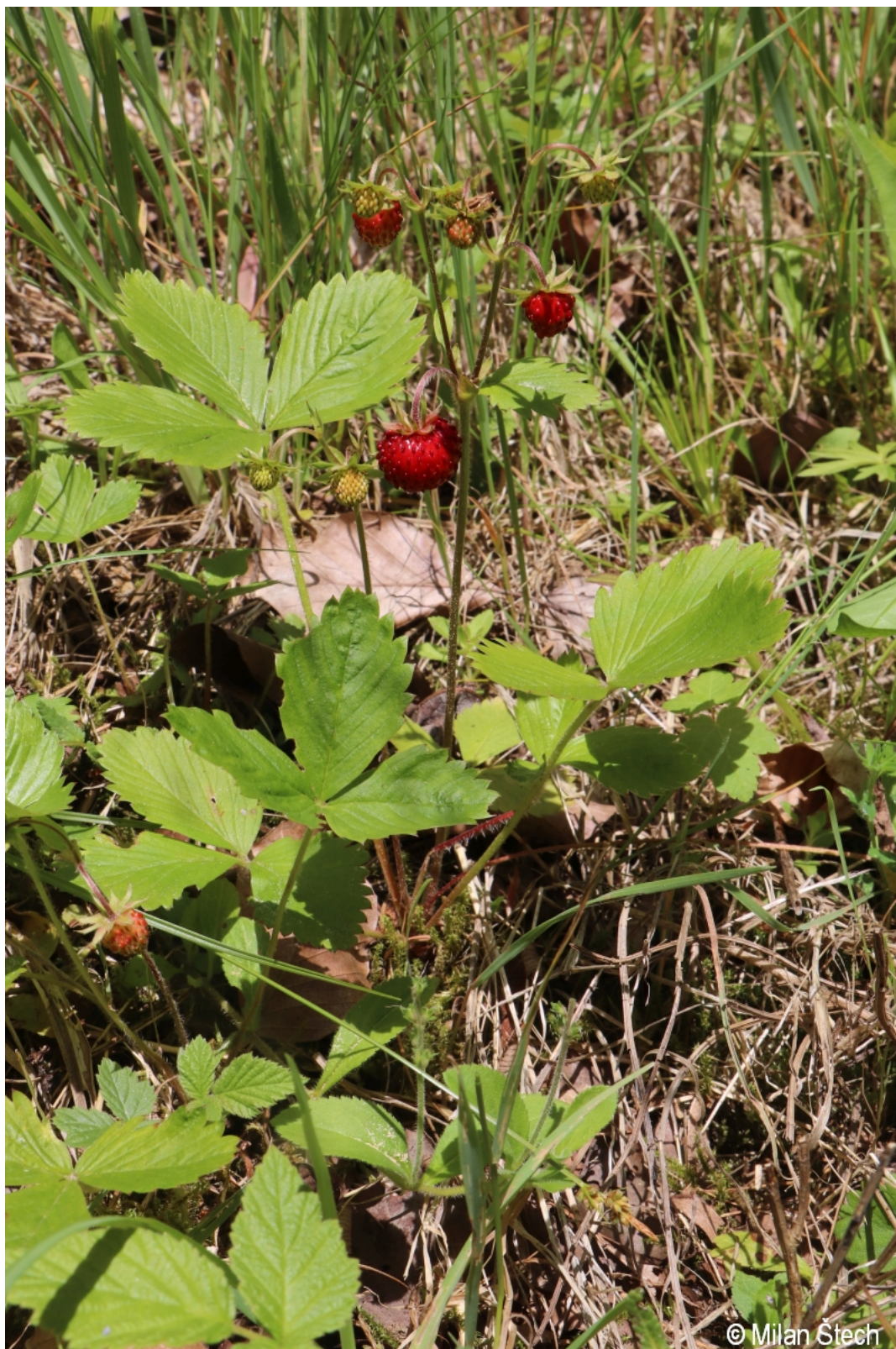
Fragaria vesca – Milan Štech – Kockendorf.