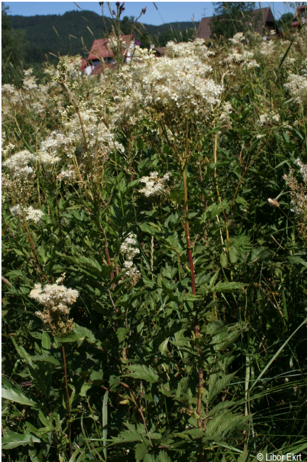
Filipendula ulmaria – Libor Ekrť – Strážný.