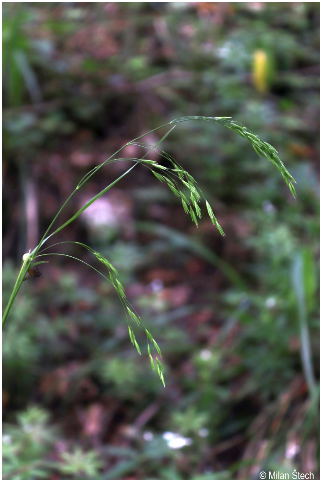
Festuca altissima – Milan Štech – Olšina, Suchý vrch.