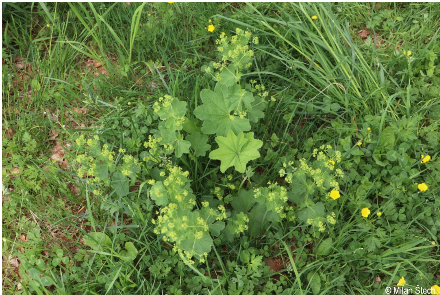
Alchemilla xanthochlora – Milan Štech – Smrčina.