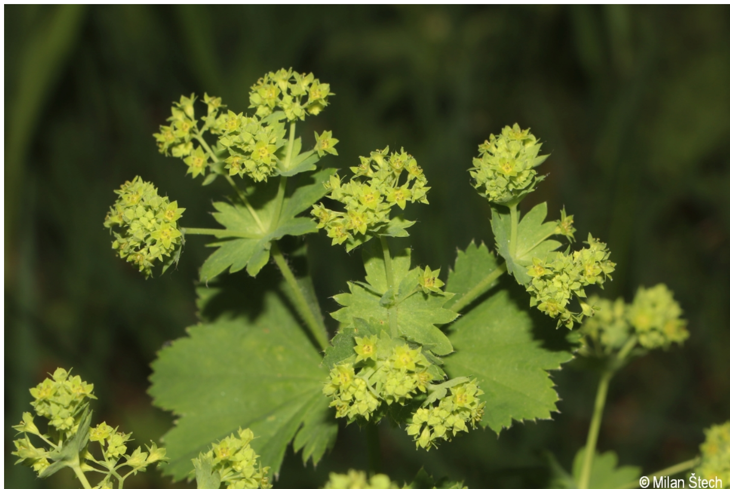
Alchemilla xanthochlora – Milan Štech – Smrčina.