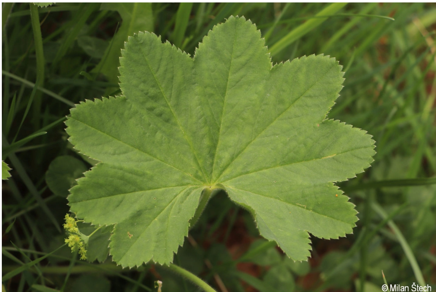
Alchemilla xanthochlora – Milan Štech – Smrčina.