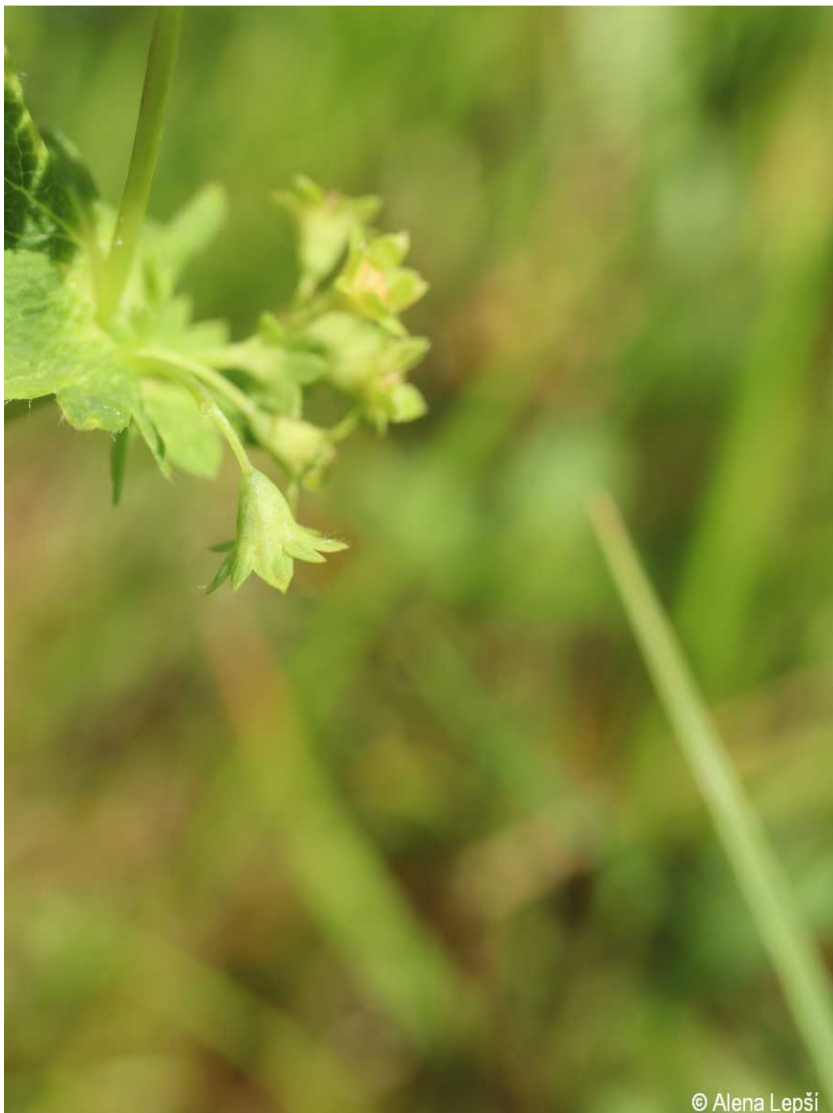
Alchemilla subcrenata – Alena Lepší – Kašperské Hory.