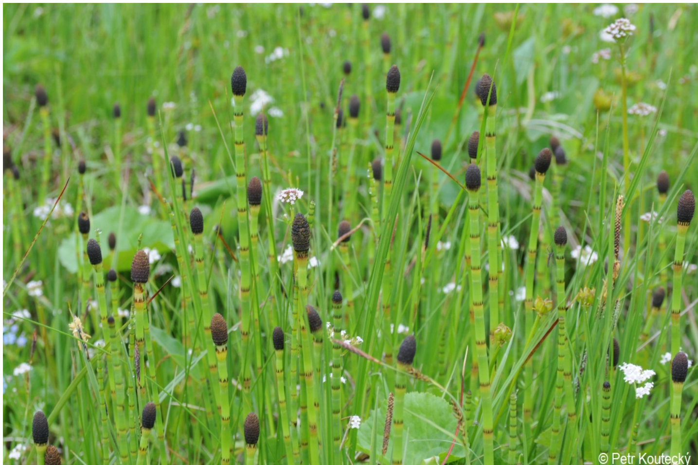
Equisetum fluviatile – Petr Koučeký – Horní Sněžná.