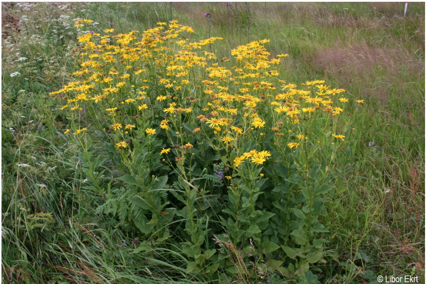
Doronicum austriacum – Libor Ekr – Horská Kvilda.