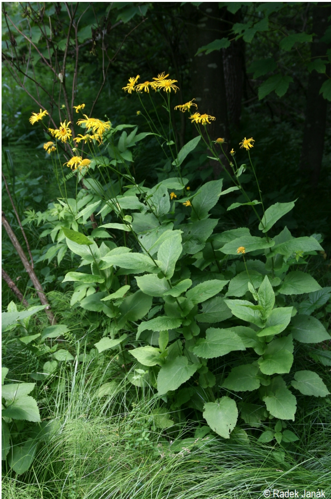
Doronicum austriacum – Radek Janák – Vyšebrodsko.