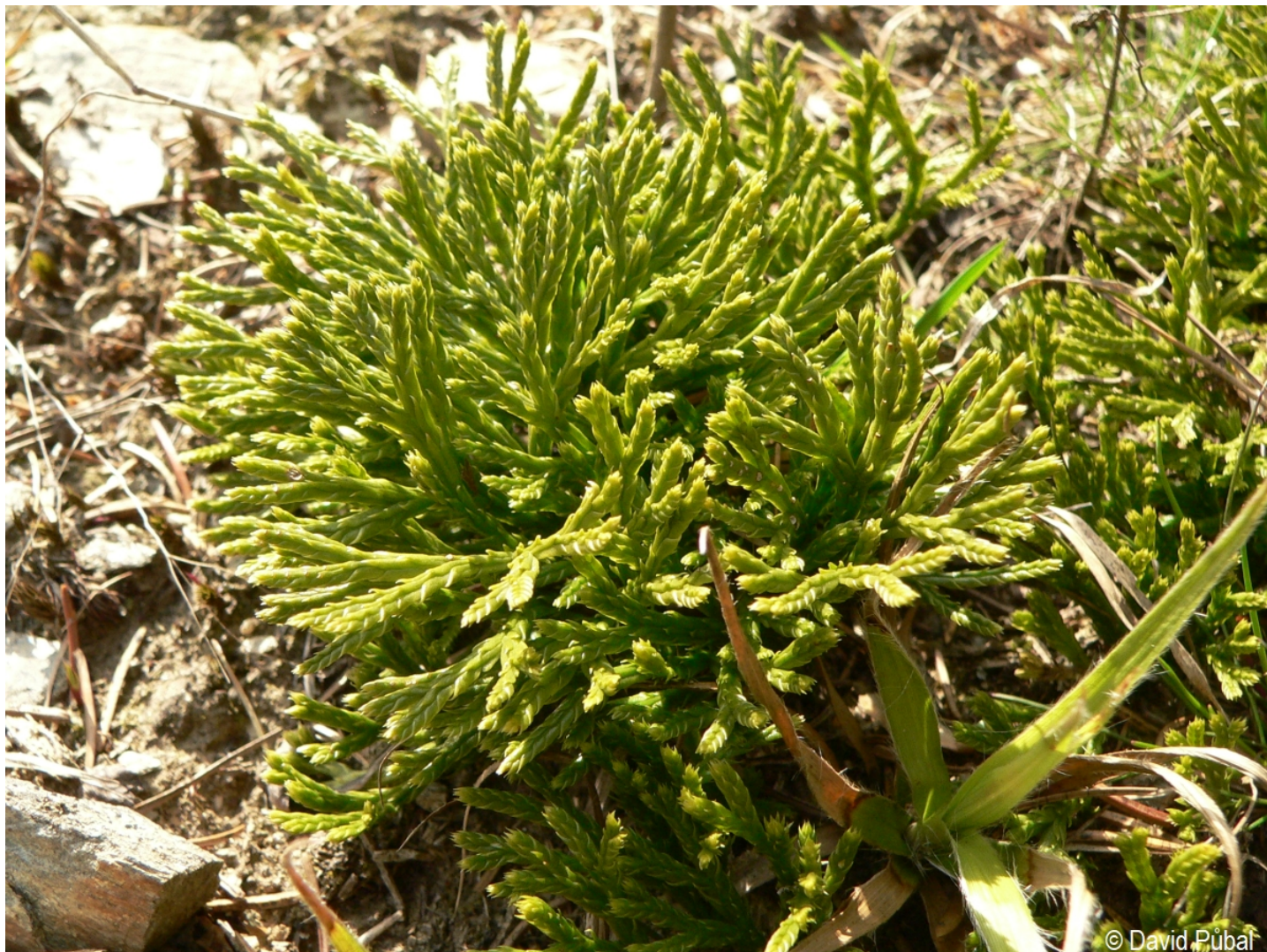
Diphasiastrum xzeileri – David Půbal – Kramolín.