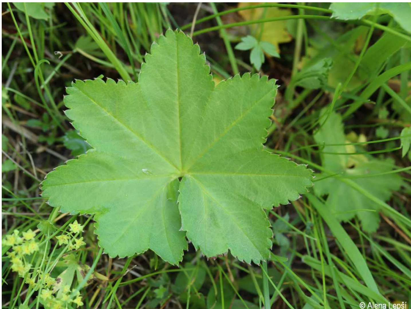
Alchemilla glabra – Alena Lepší – Kašperské Hory.